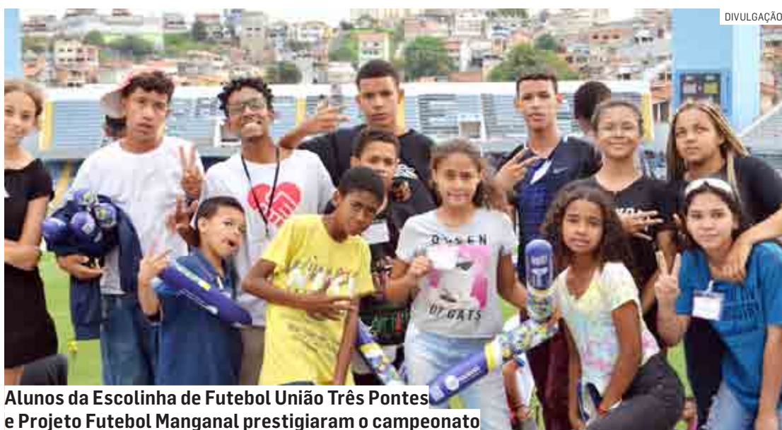
Alunos da Escolinha de Futebol União Três Pontes e Projeto Futebol Manganal prestigiaram o campeonato

No dia 19 de novembro, projetos sociais da cidade de Sumaré prestigiaram o maior campeonato entre favelas do mundo “Taça das Favelas” evento organizado pela Cufa (Central Única das Favelas). A final da Taça das Favelas aconteceu na Arena Barueri, com a viabilização da Cufa Sumaré, dois ônibus saíram de Sumaré com alunos da Escolinha de Futebol União Três Pontes e Projeto Futebol Manganal prestigiaram o campeonato