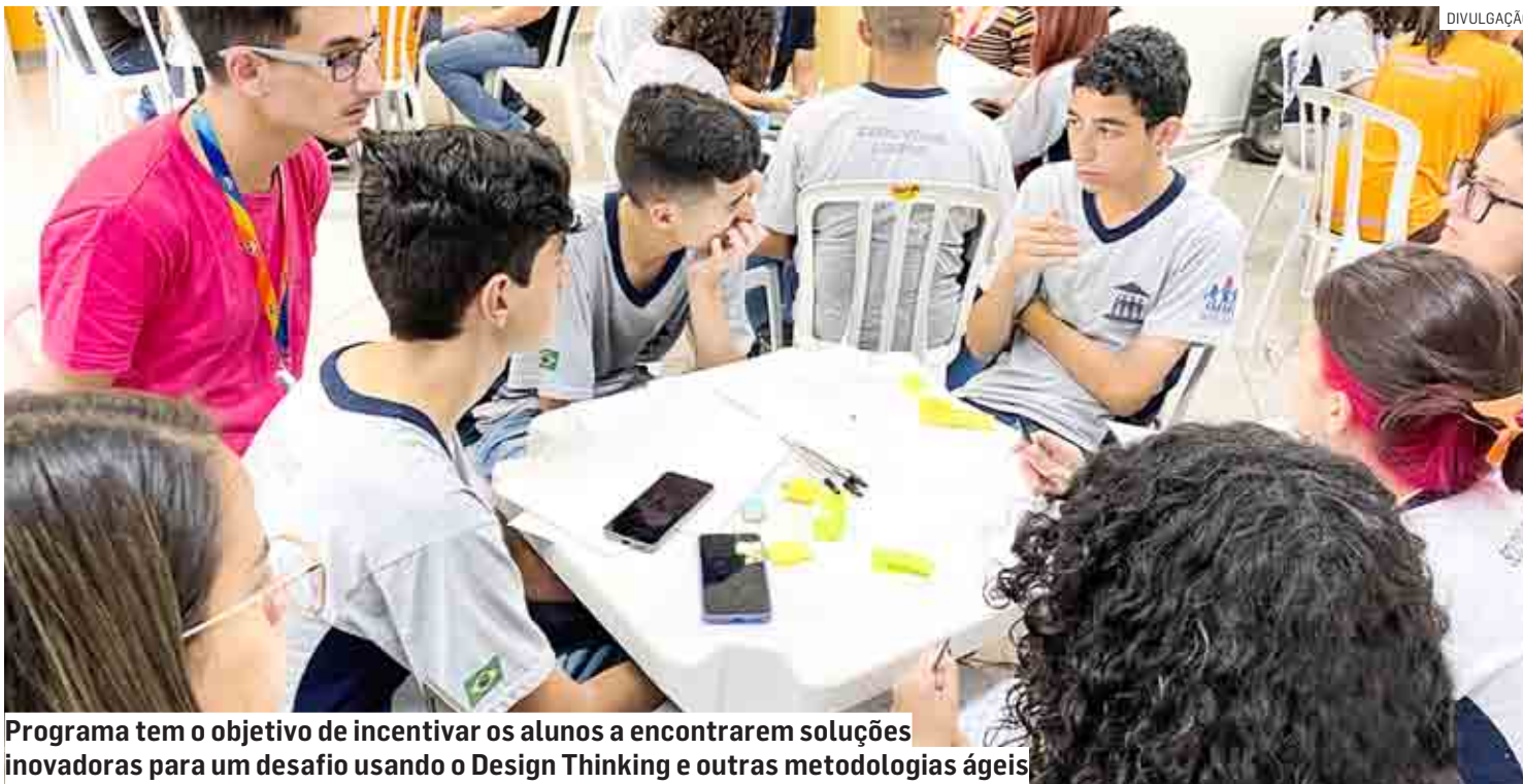
Programa tem o objetivo de incentivar os alunos a encontrarem soluções inovadoras para um desafio usando o Design Thinking e outras metodologias ágeis

Programa Innovation Camp aconteceu em parceria com a Junior Achievement, na sede da fábrica; 25 alunos apresentaram soluções inovadoras sobre redução, reciclagem e reuso de resíduos