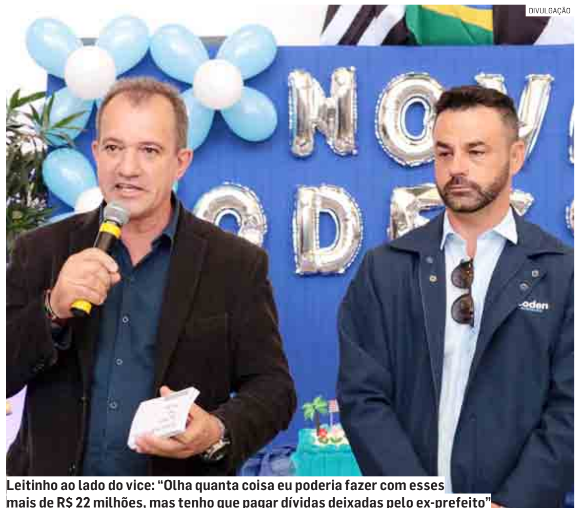
Leitinho ao lado do vice: “Olha quanta coisa eu poderia fazer com esses mais de R$ 22 milhões, mas tenho que pagar dívidas deixadas pelo ex-prefeito”

“Só para ter uma ideia, há dois meses, paguei