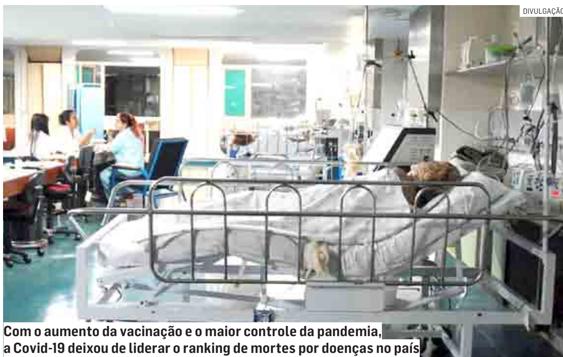
Com o aumento da vacinação e o maior controle da pandemia, a Covid-19 deixou de liderar o ranking de mortes por doenças no país

O ainda alto número de óbitos em 2022 chama mais atenção quando comparado em relação à média da evolução de mortes ano a ano no país, que variou, em média, 1,8% entre 2010 e 2019. Durante este período, a maior variação no número de óbitos no Brasil tinha ocorrido em 2016, quando registrou crescimento de 4,3%. Com exceção aos anos de 2020 e 2021, auge da pandemia no Brasil, quando os óbitos cresceram 11,8% e 23% de um ano para o outro, o ainda alto número de mortes em território nacional sugere que ainda podem haver fatores impactantes relacionados à doença.