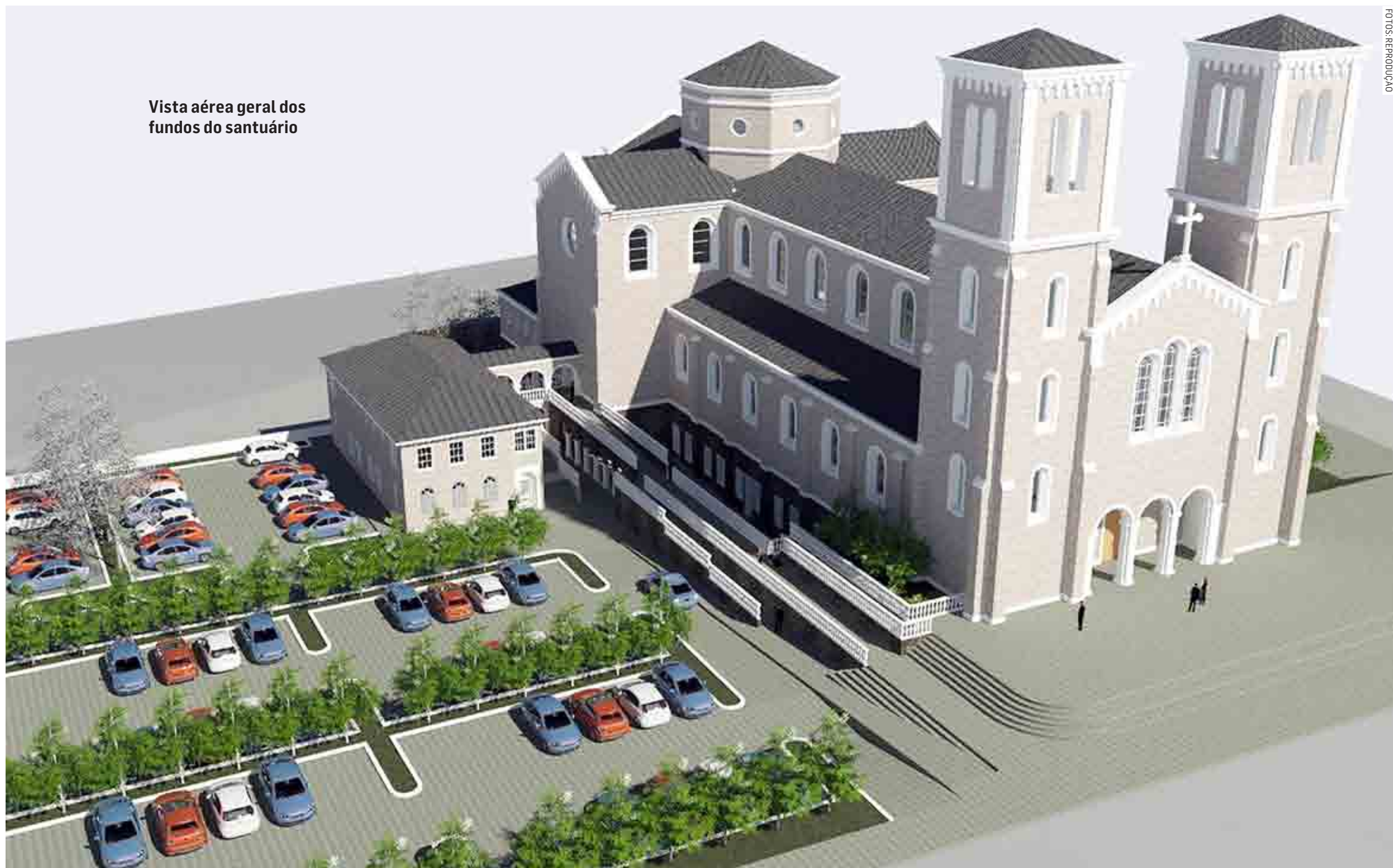
Vista aérea geral dos fundos do santuário