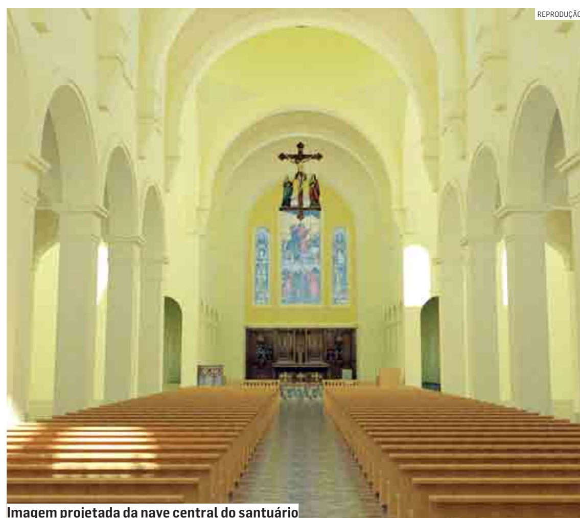
Imagem projetada da nave central do santuário

Na fachada há duas torres para os sinos, com 36 metros de altura, elemento que confere monumentalidade ao conjunto, assinala o arquiteto. Além da nova igreja, o projeto também prevê diversos espaços de apoio como casa paroquial, salão, sanitários, secretaria, escritório, salas de catequese, estacionamento, dentre outros.