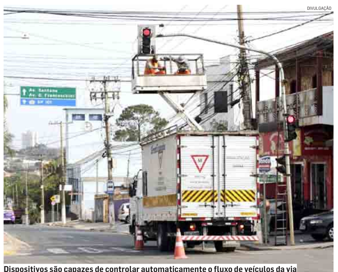
Dispositivos são capazes de controlar automaticamente o fluxo de veículos da via