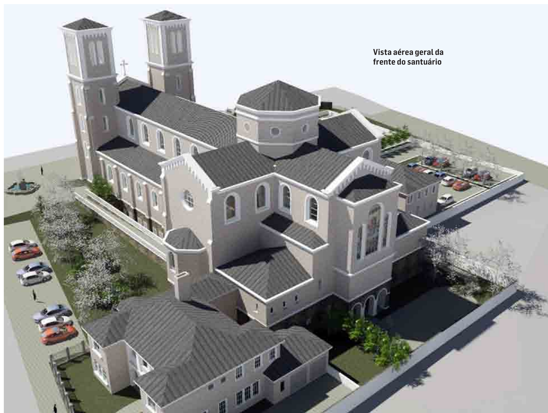
Vista aérea geral da frente do santuário

Ao todo, o templo católico terá quase 4 mil metros quadrados de área construída, 36 metros de altura e estacionamento para 350 veículos. O lote de 20 mil m 2 que abrigará o santuário, localizado entre as ruas Nicolau Martins, Paulo de Carvalho e Anna Maria Martins, já recebeu serviços de terraplenagem. Agora, a paróquia aguarda o alvará da Prefeitura para iniciar a obra. Segundo o