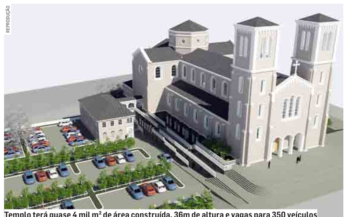
Templo terá quase 4 mil m² de área construída, 36m de altura e vagas para 350 veículos

te, o projeto arquitetônico prevê cúpula que lembra a do santuário de Aparecida do Norte (SP), além de uma estátua de bronze com mais de 2 metros de altura de São João Paulo II, logo na entrada da basílica. PÁGINAS 06 e 07