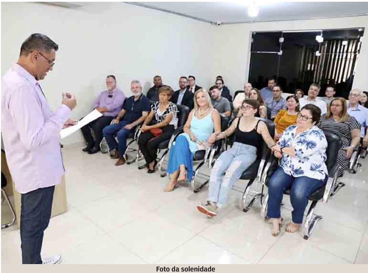
Foto da solenidade