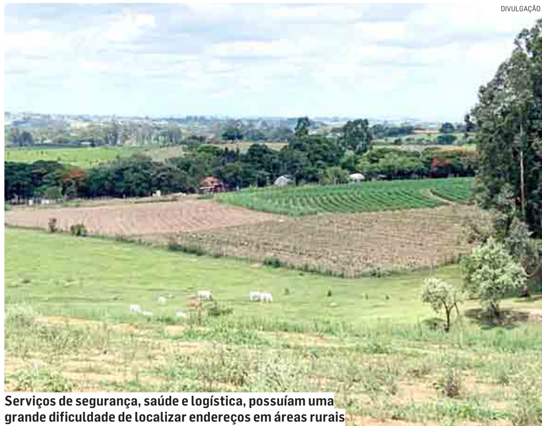
Serviços de segurança, saúde e logística, possuíam uma grande dificuldade de localizar endereços em áreas rurais

Novo código de localização proporcionará aos produtores rurais melhor facilidade de serem encontrados, para acessarem diversos serviços, inclusive públicos, de forma mais ágil