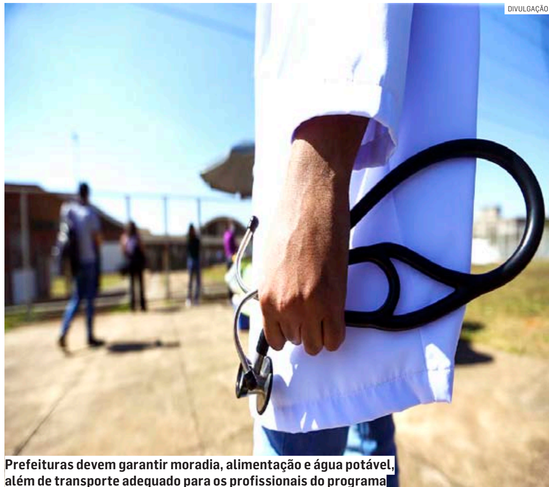
Prefeaturas devem garantir moradia, alimentação e água potável, além de transporte adequado para os profissionais do programa

Como obrigações, as prefeituras devem garantir moradia ao profissional do projeto, alimentação e água potável,