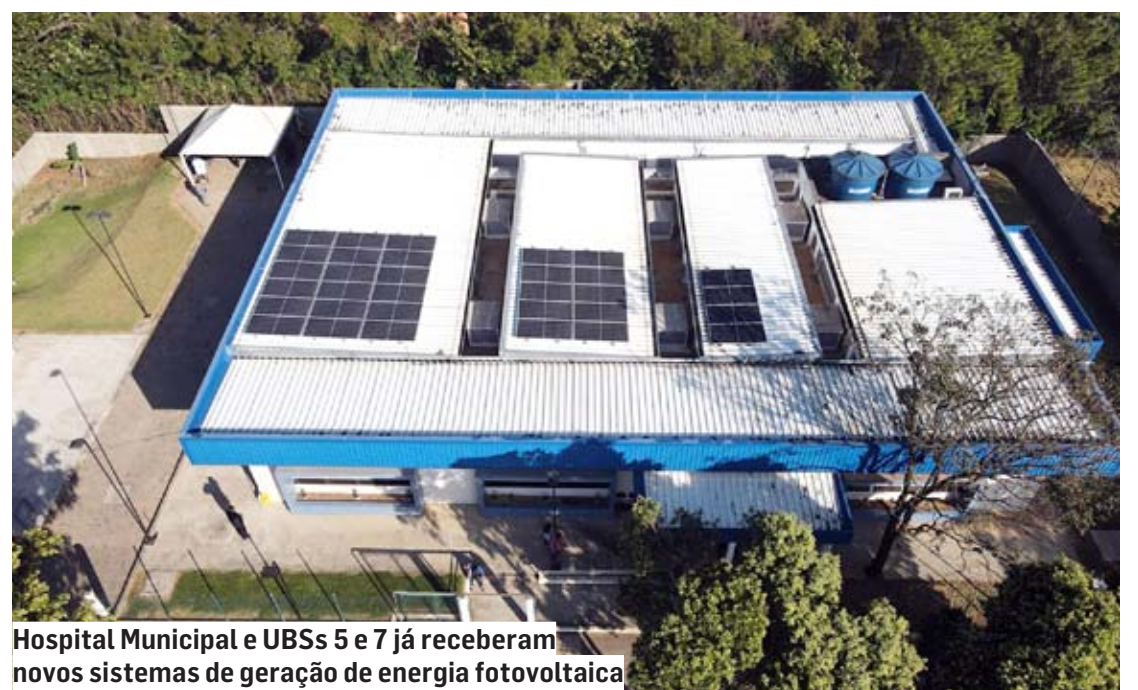
Hospital Municipal e UBSSs 5 e 7 já receberam novos sistemas de geração de energia fotovoltaica

Nenhum dos três sistemas teve custos para os cofres públicos municipais, e representam uma economia de até 80% da fatura no período de outono/inverno, podendo alcançar a economia mensal de até 95% da fatura na primavera/verão. Somando ao sistema anterior, instalado no Hospital Municipal, a Prefeitura já economizou R$ 52 mil e evitou a emissão de mais de 14 mil toneladas de CO2 na atmosfera.