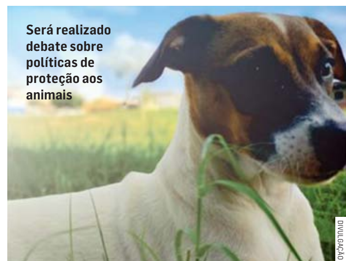
Será realizado debate sobre políticas de proteção aos animais

10h10 – início das palestras 11h – coffee break 11h40 – fórum de discussão 11h40 – início das eleições 12h30 – encerramento