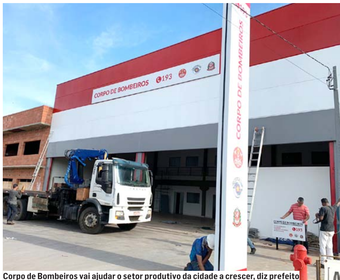
Corpo de Bombeiros vai ajudar o setor produtivo da cidade a crescer, diz prefeito