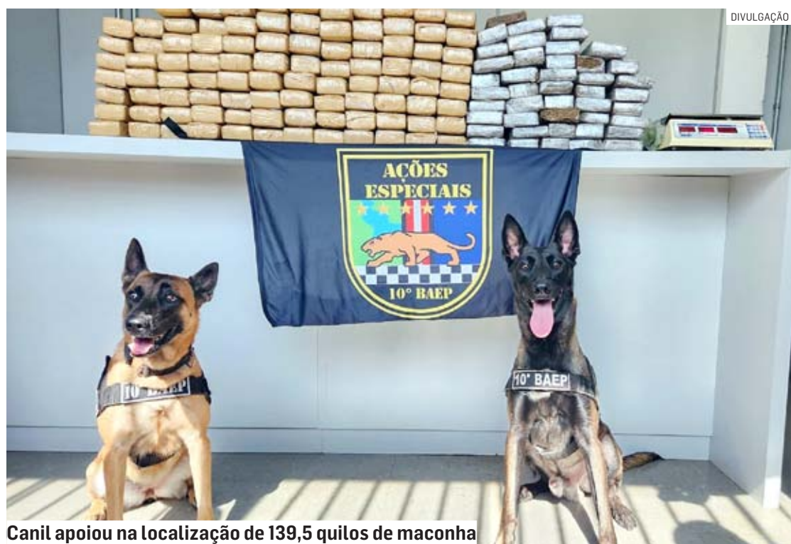
Canil apoiou na localização de 139,5 quilos de maconha