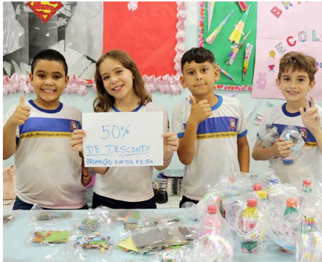
Programas e ferramentas tecnológicas foram disponibilizados aos alunos da cidade

tas tecnológicas, como as aulas de robótica aos alunos do 1º e 2º anos do Fundamental, lousas digitais em 105 salas de aula (90% do total da Rede Municipal), a implantação de internet wi-fi (sem fio) nas 25 creches e escolas, a adoção do aplicativo de aulas online “Creator4All”, a distribuição do kit de material escolar e de dois kits de livros da “Biblioteca em Casa” com 8 livros cada, além do kit