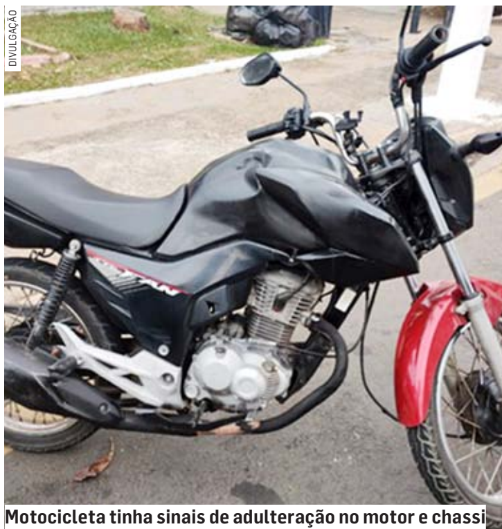
Motocicleta tinha sinais de adulteração no motor e chassi

O casal foi conduzido ao Plantão Policial de Hortolândia, onde o condutor permaneceu preso.