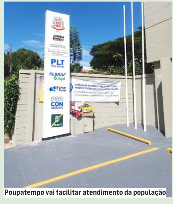
Poupatempo vai facilitar atendimento da população