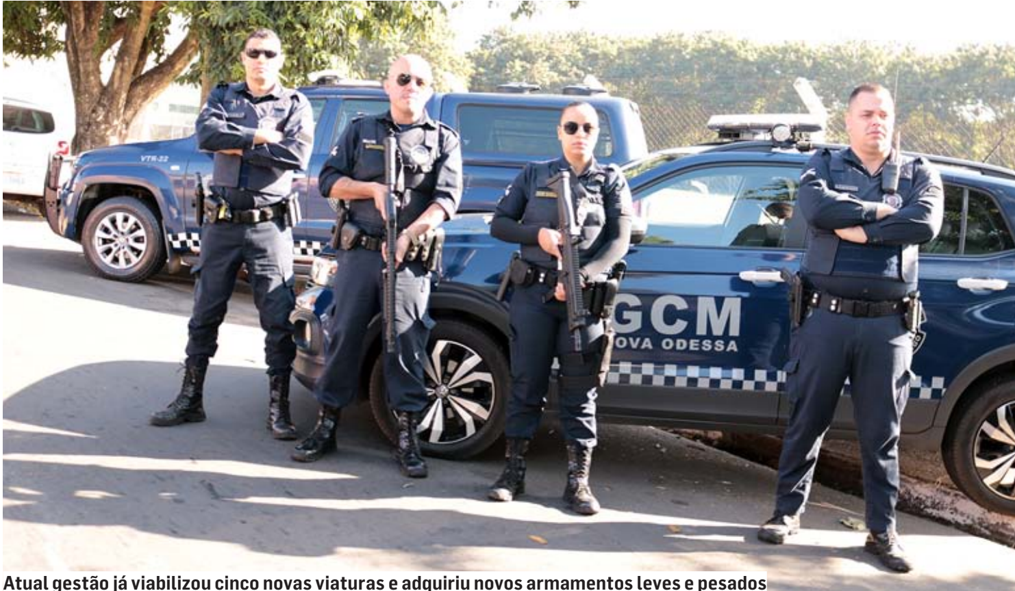
Atual gestão já viabilizou cinco novas viaturas e adquiriu novos armamentos leves e pesados