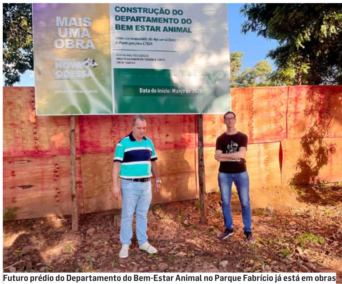
Futuro prédio do Departamento do Bem-Estar Animal no Parque Fabrício já está em obras

seguida, o prédio vai ser equipado, mobiliado e ganhar uma equipe própria.