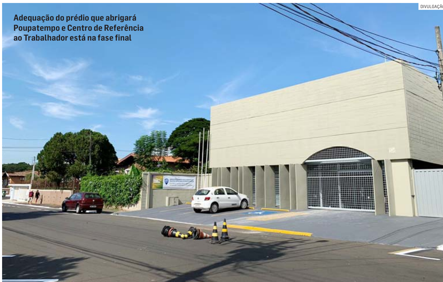
Adequação do prédio que abrigará Poupatempo e Centro de Referência ao Trabalhador está na fase final

A criação do Centro é uma parceria da Prefeitura com a RMC (Região Metropolitana de Campinas), com recursos do Fundocamp, e vai reunir num só endereço diversos serviços municipais ao cidadão além do Poupatempo, como o PLT (Posto Local do Trabalho), Procon, Sebrae Aqui, Banco do Povo Paulista, a Junta do Serviço Militar, um espaço pa-