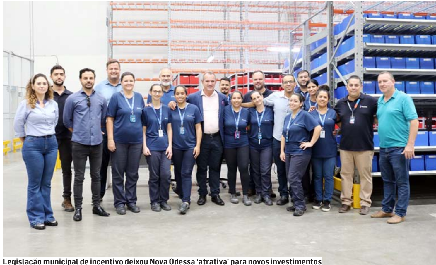
Legislação municipal de incentivo deixou Nova Odessa 'atrativa' para novos investimentos

Grças a uma série de medidas tomadas pela gestão do prefeito Cláudio Schooder (o Leitinho) desde 2021, ainda durante a fase mais crítica da pandemia, a Economia de Nova Odessa voltou a crescer. O processo de retomada do desenvolvimento econômico sustentável da cidade começou pela modernização da Lei de Incentivo do ProdeNO (Programa de Incentivo ao Desenvolvimento Econômico de Nova Odessa), ainda em 2021.