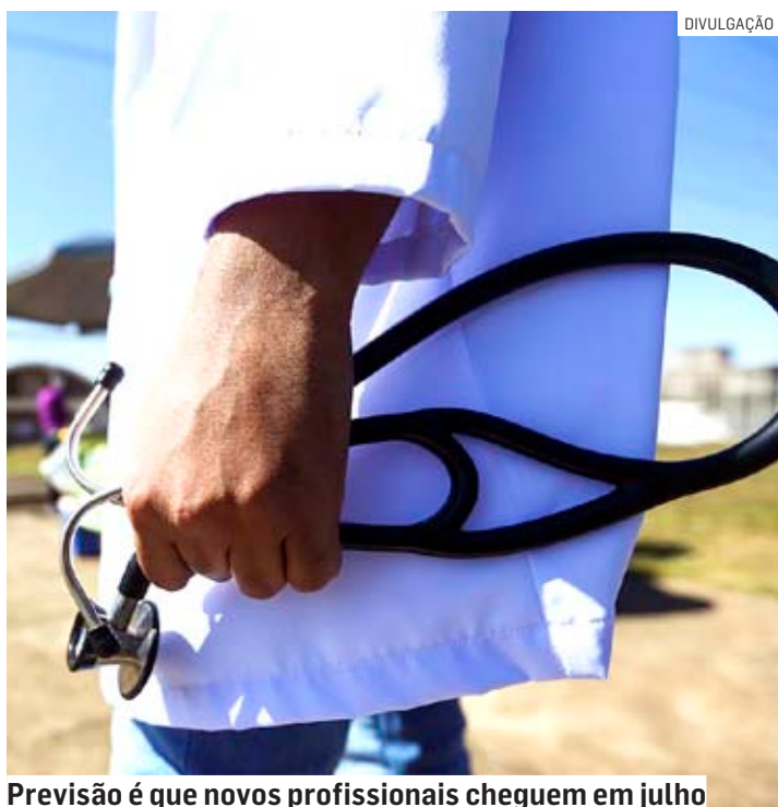
Previsão é que novos profissionais cheguem em julho