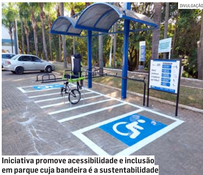
Iniciativa promove acessibilidade e inclusão em parque cuja bandeira é a sustentabilidade

Qualquer pessoa interessada em realizar a trilha com a cadeira pode entrar em contato com a coordenação do parque, através do número (19) 3845-1149 ou pessoalmente, e agendar um passeio. O Parque Socioambiental Irmã Dorothy Stang conta com uma trilha ecológica