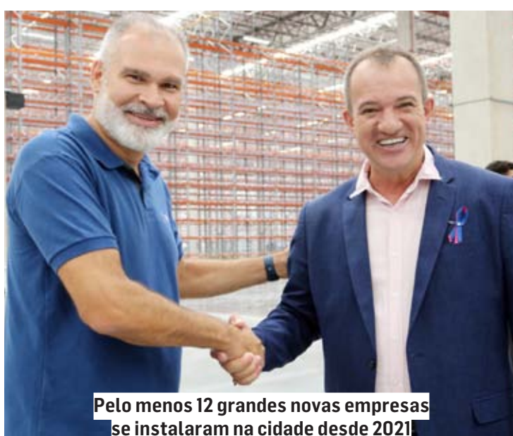
Pelo menos 12 grandes novas empresas se instalaram na cidade desde 2021

"São ao menos 12 grandes novas empresas atraídas para a cidade desde 2021", lembrou Leitinho, destacando também o papel do vice-prefeito Mineirinho no trabalho de manter contato institucional constante com as empresas já instaladas na cidade, identificando demandas que possam ser solucionadas pelo Poder Público Municipal, como questões de infraestrutura urbana.