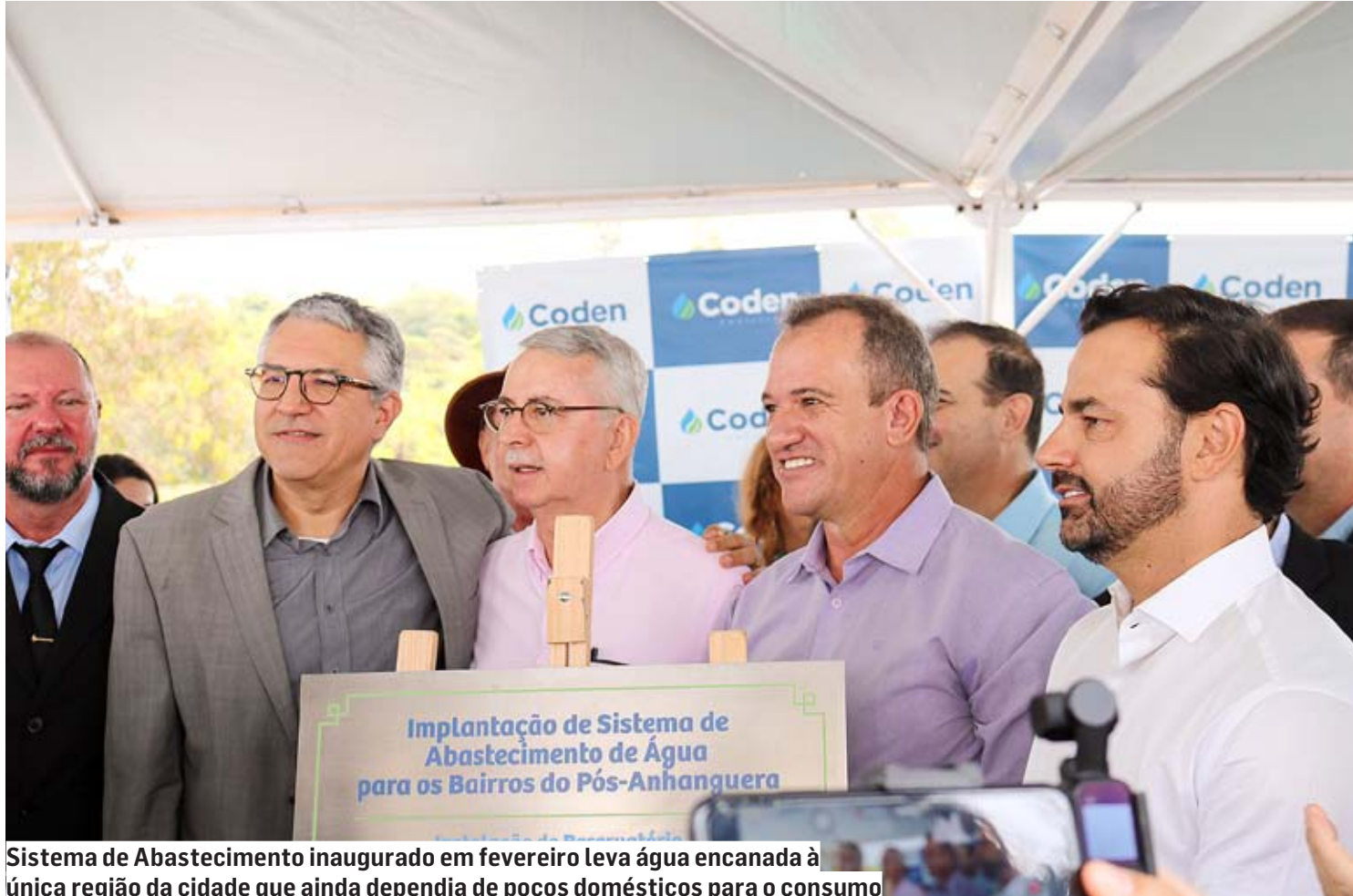
Sistema de Abastecimento inaugurado em fevereiro leva água encanada à única região da cidade que ainda dependia de poços domésticos para o consumo