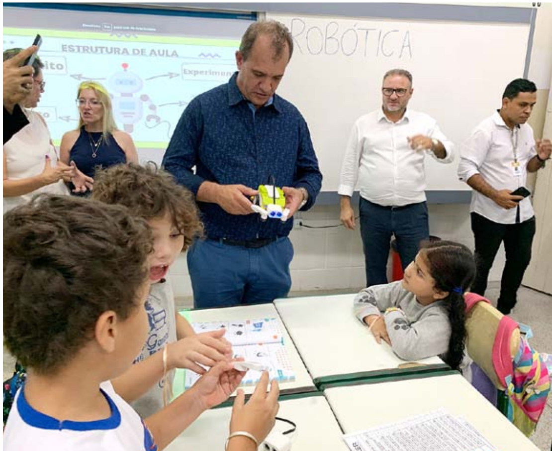
Alunos da Rede Municipal são preparados para o mercado de trabalho do presente e do futuro

Desde a retomada das aulas presenciais, em 2022, a Prefeitura de Nova Odessa adquiriu diversos equipamentos e aplicativos da chamada “Educação Tecnológica”, ou “Educação 4.0”. Segundo o prefeito Cláudio Schooder (o Leitinho), o programa como um todo busca preparar os alunos da Rede Municipal para o mercado de trabalho do presente e do futuro, baseado cada vez mais no digital e no virtual.