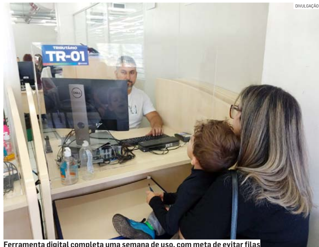
Ferramenta digital completa uma semana de uso, com meta de evitar filas