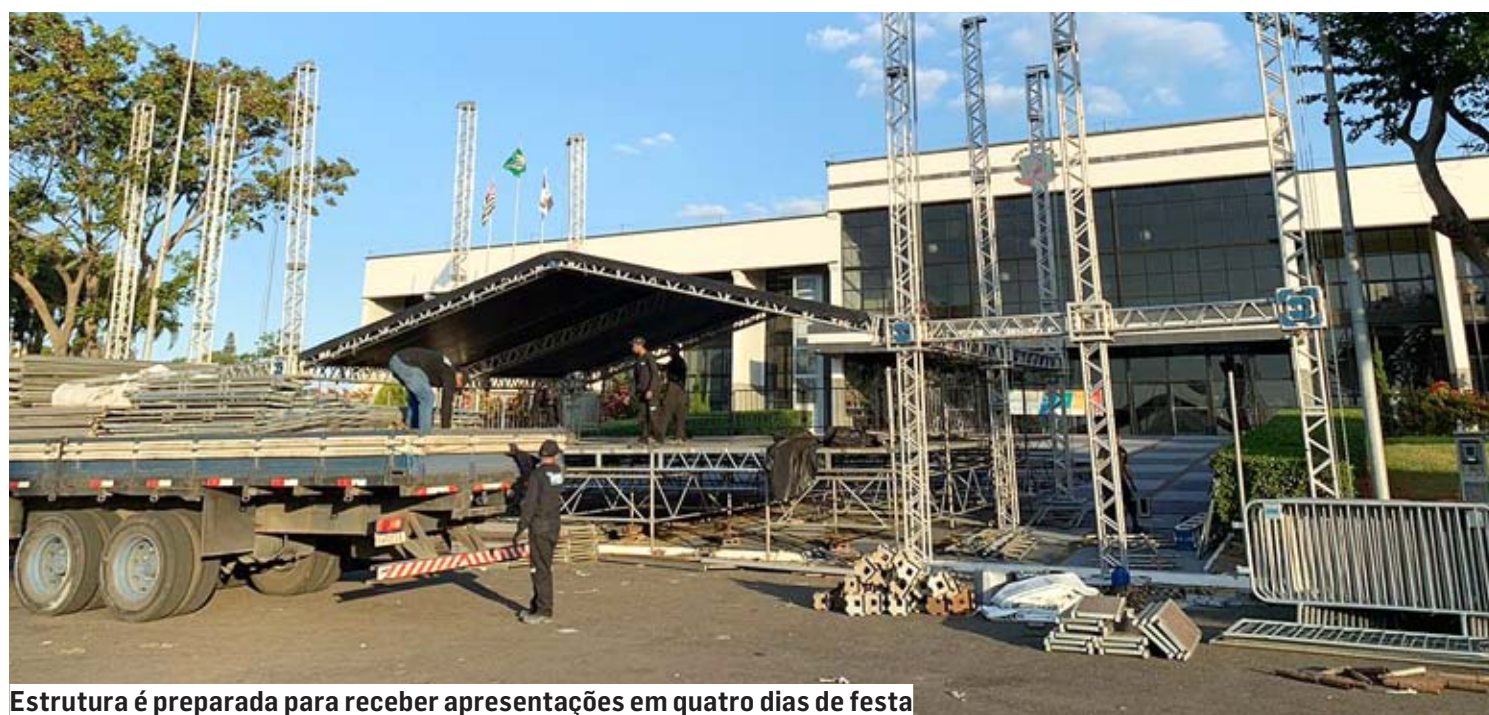
Estrutura é preparada para receber apresentações em quatro dias de festa

A Praça dos Três Poderes está ganhando o palco para a festa de aniversário de 118 anos de Nova Odessa, que começa nesta quinta-feira (25) e prossegue com sé-