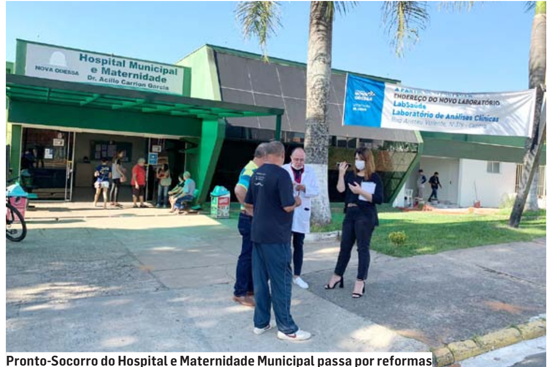
Pronto-Socorro do Hospital e Maternidade Municipal passa por reformas

Atualmente, os pacientes de Nova Odessa que precisam de internação em leitos de alta complexidade de UTI são encaminhados para hospitais públicos de