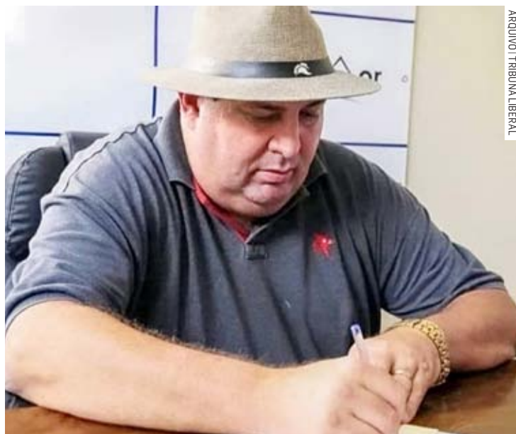
Edivaldo Brischi movimenta diário oficial com exonerações

Esse é o segundo secretário de Brischi que deixa a pasta em um período de três dias. A nova demissão ocorre durante questionamentos ao primeiro escalão do governo, que abriga o secretário