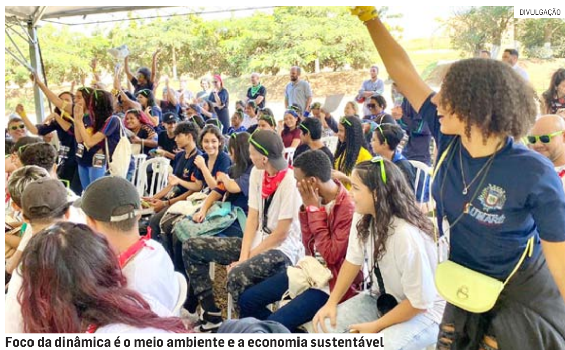
Foco da dinâmica é o meio ambiente e a economia sustentável