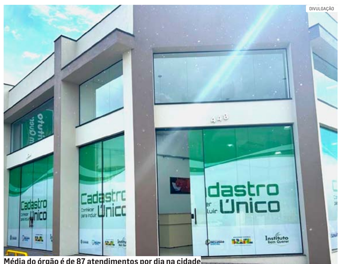
Média do órgão é de 87 atendimentos por dia na cidade

No dia 19 de abril, a nova sede da Central de Cadastro Único foi inaugurada. O local concentra os atendimentos referentes ao CadÚnico - base de dados do Governo Federal em que estão registradas as informações socioeconômicas das famílias de baixa renda domicilia-