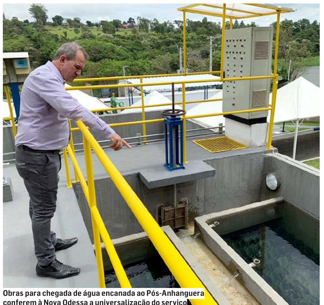
Obras para chegada de água encanada ao Pós-Anhanguera conferem à Nova Odessa a universalização do serviço

Inaugurada no último dia 24 de fevereiro com a presença do ministro de Relações Institucionais, Alexandre Padilha, a nova ETA (Estação de Tratamento de Água) 2 Santo Ângelo e o Sistema de Abastecimento de Água Pós-Anhanguera, que significaram um investimento de R$ 8,5 milhões na qualidade de vida e na segurança hídrica da população.