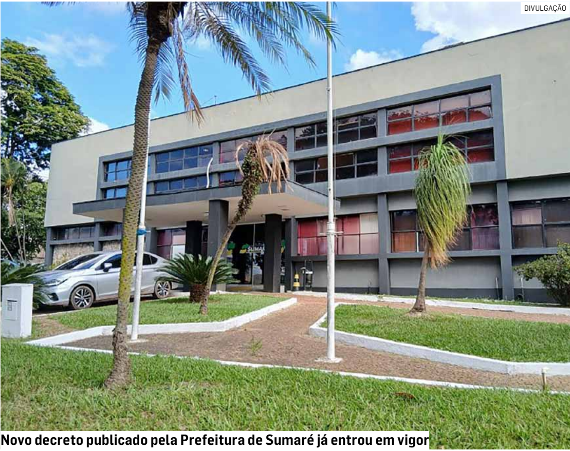
Novo decreto publicado pela Prefeitura de Sumaré já entrou em vigor

A Prefeitura de Sumaré publicou decreto que altera dispositivos de uma norma de 2023, com o objetivo de atualizar definições e competências no âmbito da administração pública municipal. A principal mudança promovida pelo novo decreto está na redefinição de conceitos e passa a esclarecer que a chamada “alta administração” é composta pelo prefeito, secretários municipais e diretores executivos, no âmbito da Administração Direta, bem como pela autoridade máxima de cada entidade na Administração Indireta. Além disso, redefine o conceito de “órgãos”, especificando que estes correspondem às secretarias municipais e diretorias executivas. Outra alteração diz respeito ao artigo 15 do decreto original. Com a nova redação, fica estabelecido que compete aos secretários municipais e diretores executivos, e, no caso da Administração Indireta, à autoridade máxima da entidade, conduzir os processos licitatórios e de contratação direta de interesse de suas respectivas áreas. Essas atribuições devem observar os requisitos previstos na Nova Lei de Licitações, bem como os regulamentos aplicáveis. De acordo com o decreto, as mudanças buscam conferir maior clareza normativa e adequação à legislação federal vigente, fortalecendo a organização administrativa e a segurança jurídica nos procedimentos de compras públicas do município.