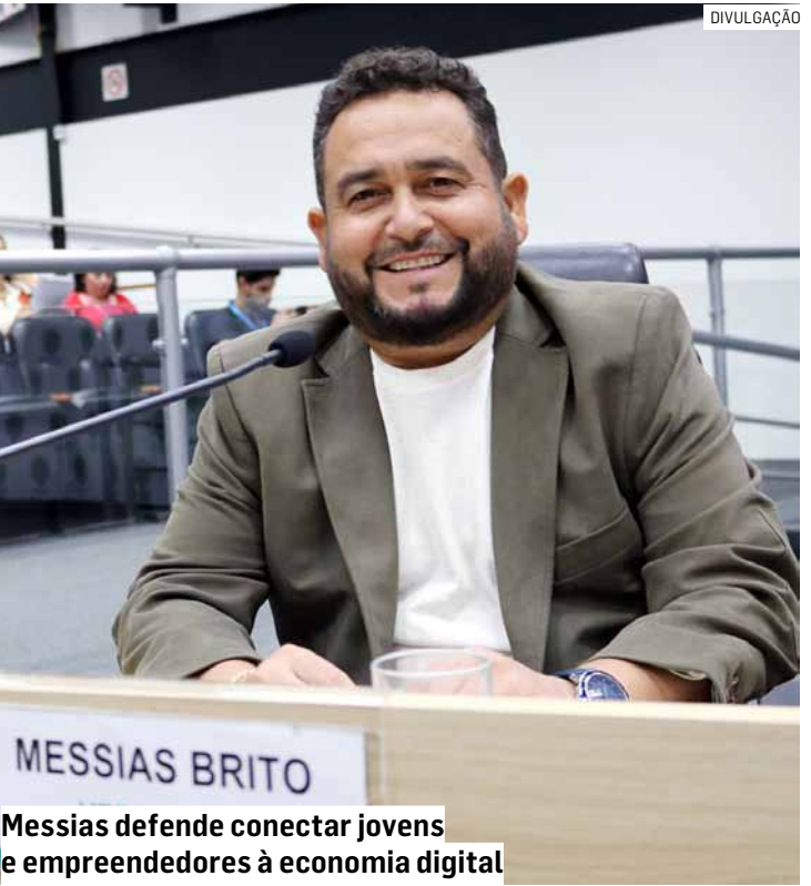
Messias defende conectar jovens e empreendedores à economia digital

Outras emendas são para a Festa do Nordeste, reforma da quadra esportiva localizada na praça do São José I e compra de equipamentos permanentes para as Unidades de Pronto Atendimento (UPAs) dos bairros São José e Monte Alegre.