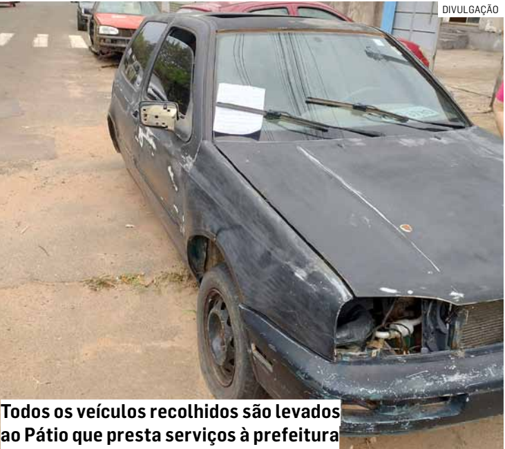
Todos os veículos recolhidos são levados ao Pátio que presta serviços à prefeitura

Denúncias sobre veículos abandonados nas vias públicas podem ser feitas para o 0800-772-7722.