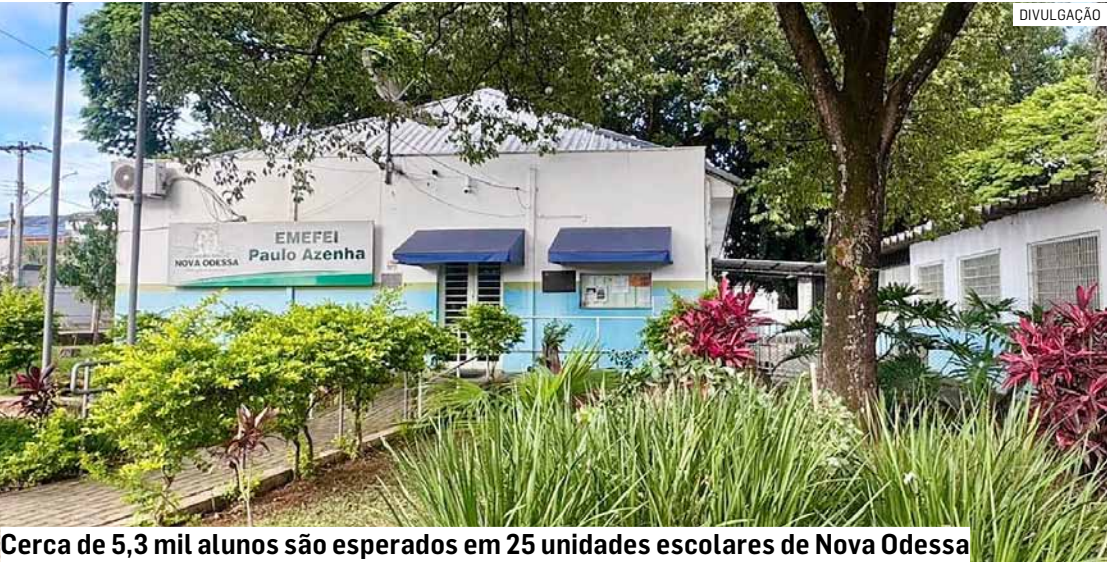
Cerca de 5,3 mil alunos são esperados em 25 unidades escolares de Nova Odessa