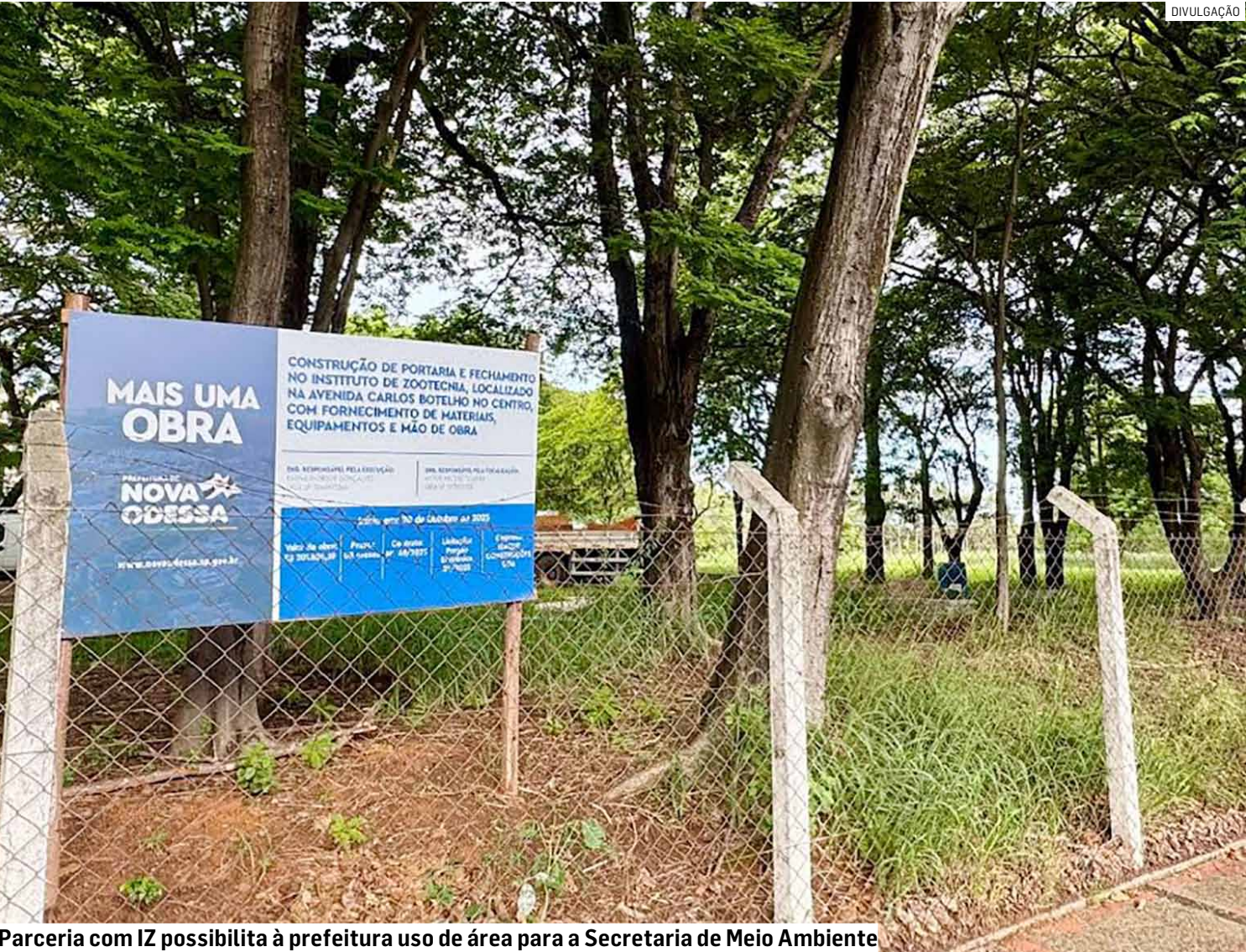
Parceria com IZ possibilita à prefeitura uso de área para a Secretaria de Meio Ambiente

Intervenção realizada tem etapas programadas como a construção de guarita, instalação de alambrado e nivelamento do estacionamento, com entrada independente para Secretaria de Meio Ambiente, Zoonoses e Defesa Civil Municipal