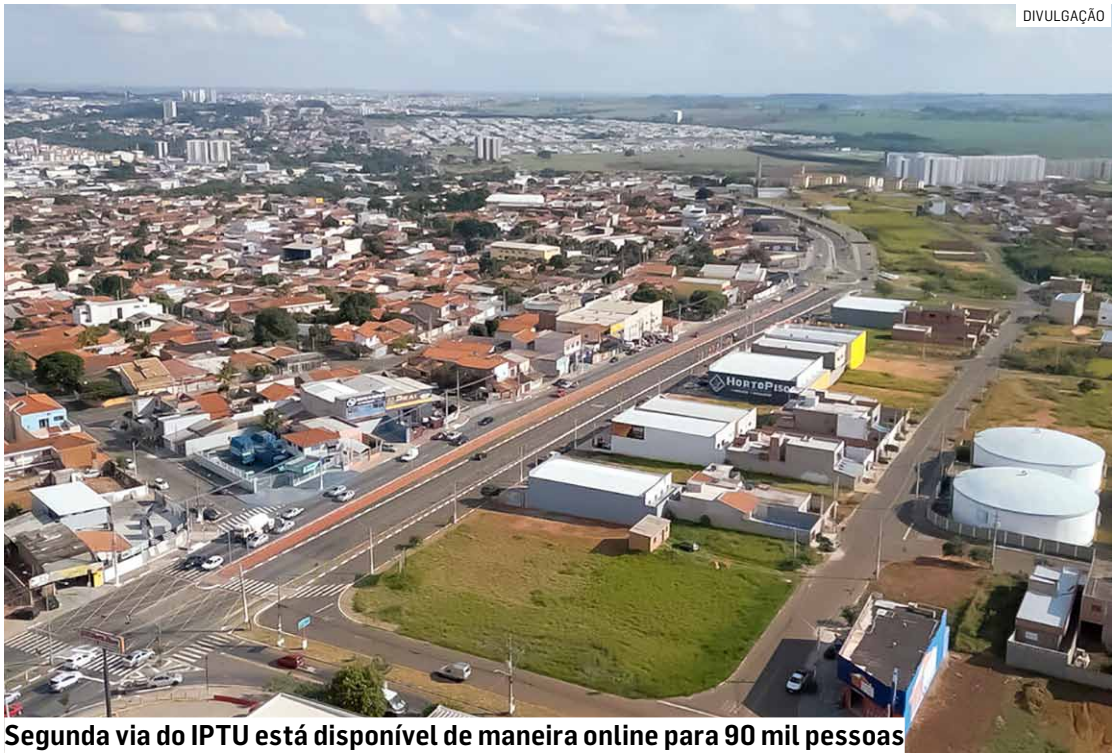
Segunda via do IPTU está disponível de maneira online para 90 mil pessoas

Devido ao recente término da greve dos Correios e da alta demanda, o prazo de entrega dos carnês do IPTU (Imposto Predial e Territorial Urbano) 2026 nas residências vai ocorrer até o final de fevereiro para aproximadamente 90 mil contribuintes de Hortolândia. Quem optar pelo pagamento à vista terá desconto de 5% caso o imóvel não tenha débito. Tanto a cota única quanto a primeira parcela vencem no dia 10 de março. No caso de pagamento parcelado, a data de vencimento será no dia 10 de cada mês, sendo que o pagamento poderá ser feito em até dez parcelas. A prefeitura disponibiliza a 2ª via do boleto de maneira online, por meio do link ( https://www.hortolandia.sp.gov.br/paginas-de-servico/emissao-de-segunda-via-do-carne-de-iptu/ ). Já os contribuintes em atraso podem regularizar a situação aderindo ao REFIS (Programa de Recuperação Fiscal) que, neste ano, foi prorrogado até o dia 31 de março. O atendimento presencial para o