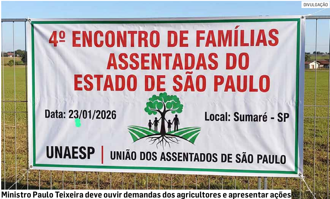
Ministro Paulo Teixeira deve ouvir demandas dos agricultores e apresentar ações

Entre os destaques da programação está a presença do ministro Paulo Teixeira, do Ministério do Desenvolvimento Agrário e Agricultura Familiar, que participará da