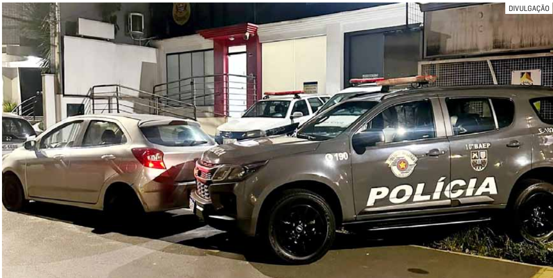
Homens receberam voz de prisão e foram encaminhados ao Plantão Policial de Nova Odessa

Na tentativa de fuga, o carro foi conduzido até uma praça pública, onde acabou sendo interceptado e os ocupantes abordados. Durante a busca pes-