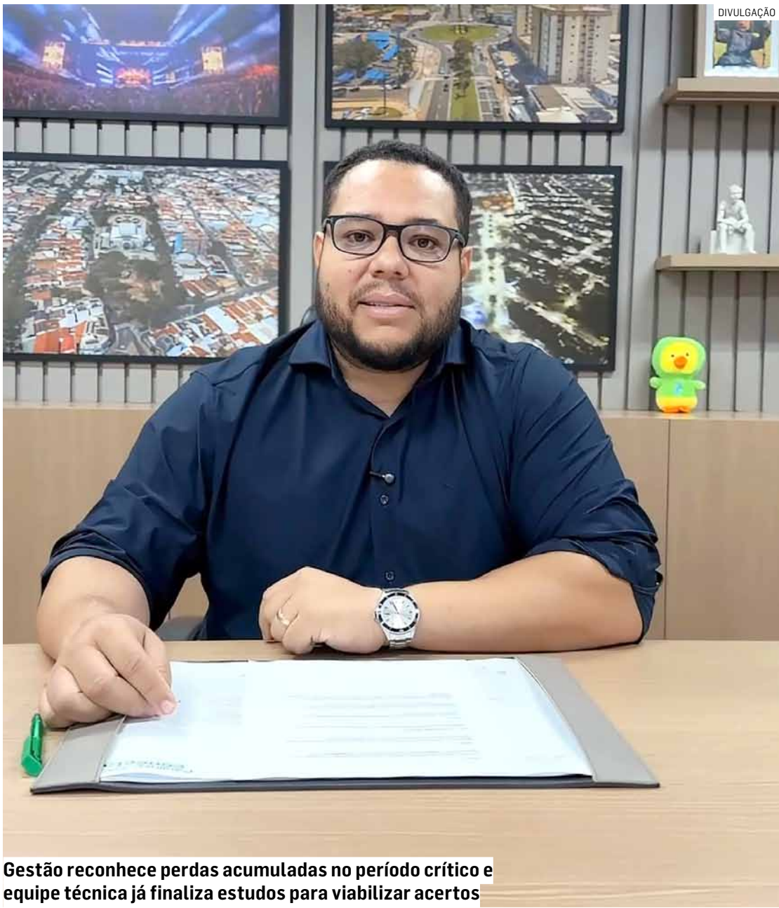
Gestão reconhece perdas acumuladas no período crítico e equipe técnica já finaliza estudos para viabilizar acertos

Medida atende reivindicação antiga de servidores municipais por direito que havia sido suspenso durante período de pandemia da Covid-19; projeto de lei será enviado para Câmara Municipal e prefeitura prevê valores retroativos