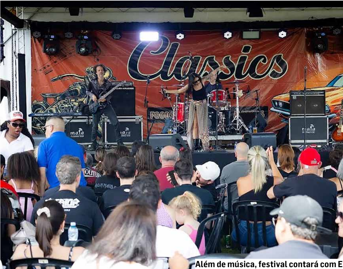
Além de música, festival contará com Espaço Kids e praça de alimentação variada

Evento acontece desta sexta a domingo no Centro de Cultura e Lazer com entrada gratuita reunindo música, carros antigos e boa gastronomia; shows trazem tributos a ícones do rock internacional como Aerosmith e Guns N’ Roses