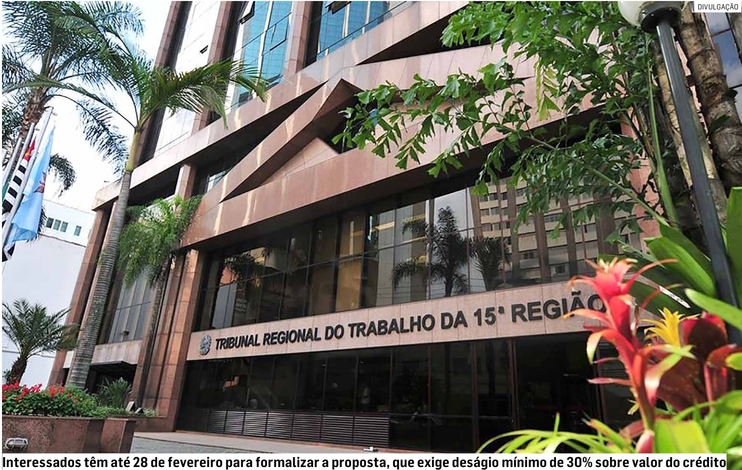
Interessados têm até 28 de fevereiro para formalizar a proposta, que exige deságio mínimo de 30% sobre valor do crédito

Município divulga comunicado oficial após homologação de edital pelo Tribunal Regional do Trabalho da 15ª Região; credores poderão antecipar recebimento mediante acordo com deságio de 30%; propostas devem ser apresentadas diretamente para Justiça do Trabalho até o fim de fevereiro