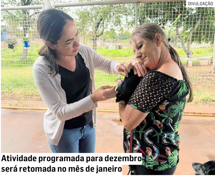
Atividade programada para dezembro será retomada no mês de janeiro

As famílias interessadas podem agendar o atendimento pelo telefone (19) 3883-7486. O serviço funciona de segunda a sexta-feira, das 8h30 às 16h30, na sede da Vigilância em Zoonoses, localizada na Avenida da Saudade, no Jardim Planalto do Sol.