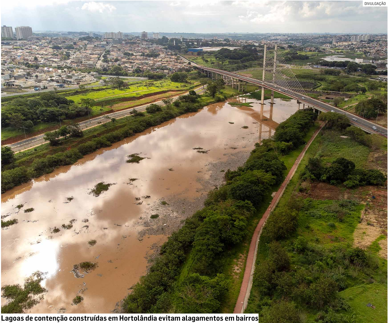
Lagoas de contenção construídas em Hortolândia evitam alagamentos em bairros

A prova mais recente dessa mudança veio neste último fim de semana. Nas últimas 72 horas, a Secretaria de Meio Ambiente, Desenvolvimento Sustentável e Assuntos Climáticos registrou 88,4 milímetros de chuva. Isso significa 88,4 litros de água por metro quadrado, um volume capaz de causar estragos em municípios despreparados. Mas,