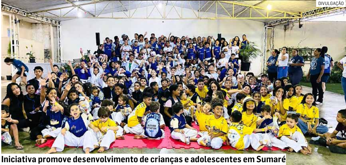
Iniciativa promove desenvolvimento de crianças e adolescentes em Sumaré

“Encerramos o projeto comemorando grande sucesso de público no evento, mais uma oportunidade para garantirmos o direito fundamental de acesso ao esporte, com qualidade, estimulando o desenvolvimento integral de crianças e adolescentes em vulnerabilidade social residente em periferias de Sumaré, adotando o esporte educacional com ferramenta de