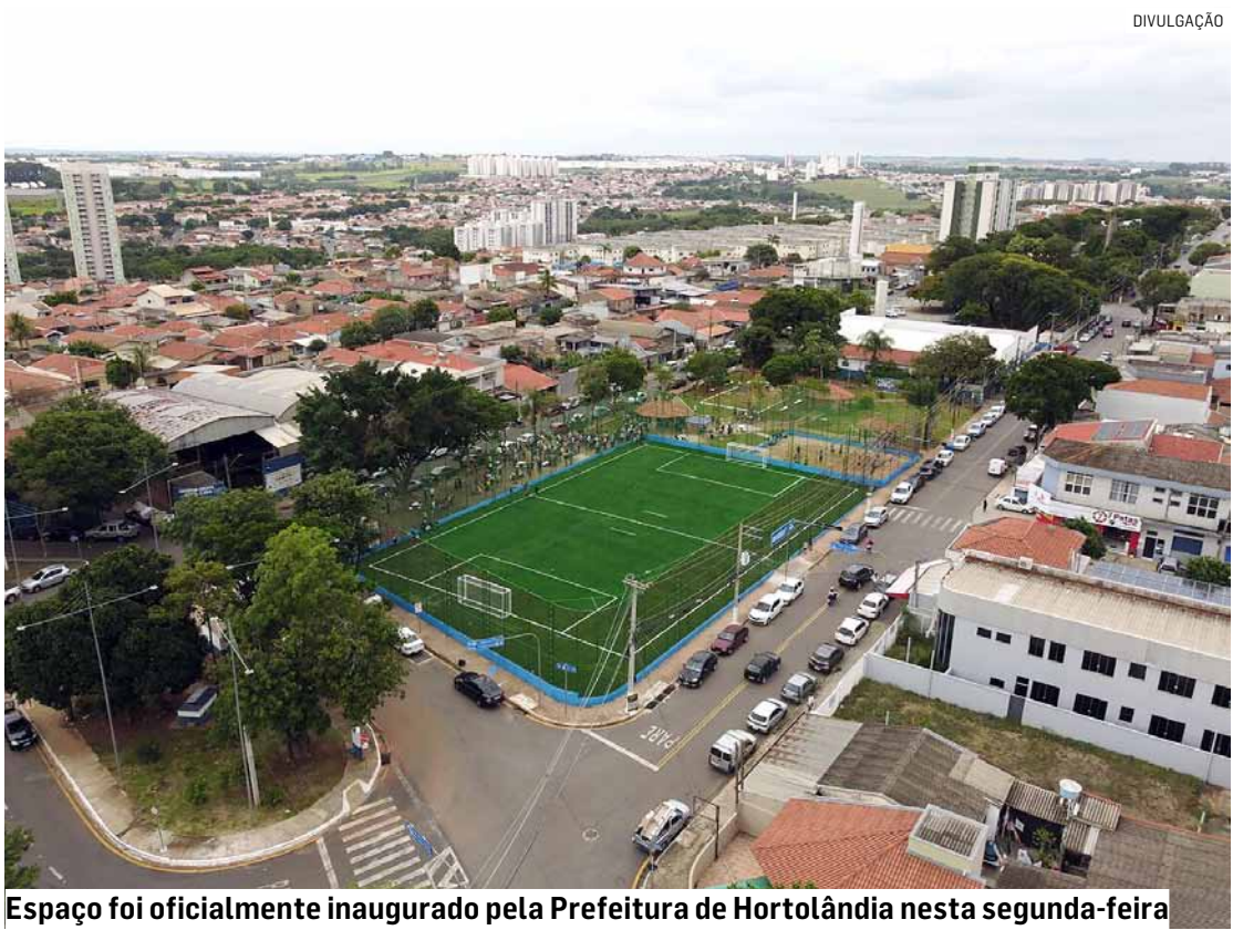
Espaço foi oficialmente inaugurado pela Prefeitura de Hortolândia nesta segunda-feira

De acordo com a Secretaria de Esporte e Lazer, es-