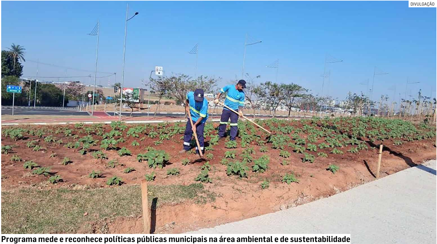
Programa mede e reconhece políticas públicas municipais na área ambiental e de sustentabilidade

De acordo com a Secretaria de Meio Ambiente, Desenvolvimento Sustentável e Assuntos Climáticos, o certificado é entregue aos municípios participantes com base nos trabalhos executados em 10 diretrizes ambientais. São elas: Governança ambiental, adaptação às mudanças climáticas, educação ambiental, saneamento básico, resíduos sólidos, qualidade do ar e mitigação de GEE (Gases de Efeito Estufa), biodiversidade, arbori-