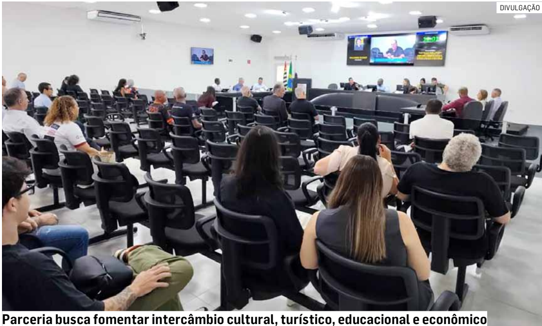
Parceria busca fomentar intercâmbio cultural, turístico, educacional e econômico