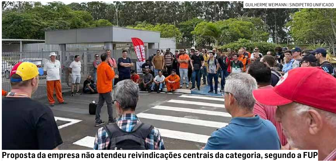
Proposta da empresa não atendeu reivindicações centrais da categoria, segundo a FUP

Os sindicatos também criticam o modelo de gestão adotado pela estatal,