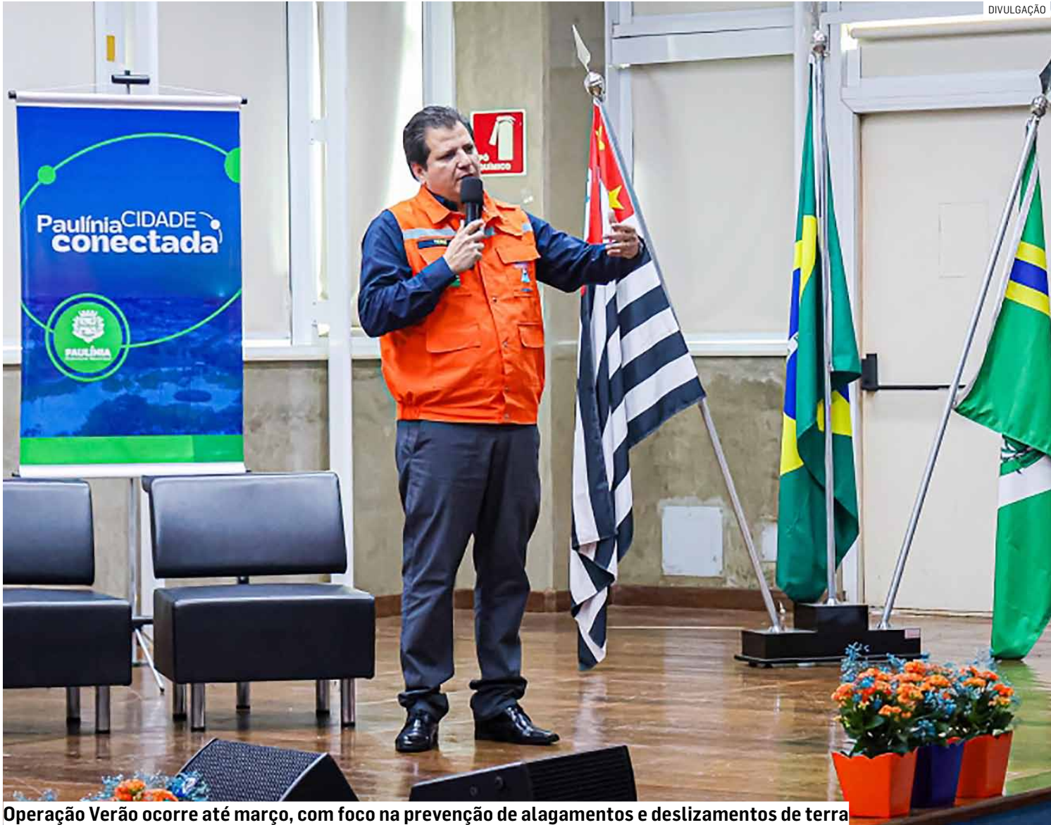
Operação Verão ocorre até março, com foco na prevenção de alagamentos e deslizamentos de terra

Levantamento da Defesa Civil aponta queda nas ocorrências em comparação com 2024; em áreas de aglomerados residenciais, redução de focos chegou a 50%; município já deu largada à Operação Verão que vai até março de 2026