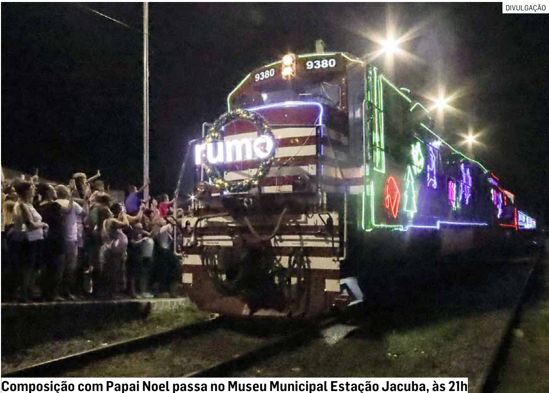
Composição com Papai Noel passa no Museu Municipal Estação Jacuba, às 21h