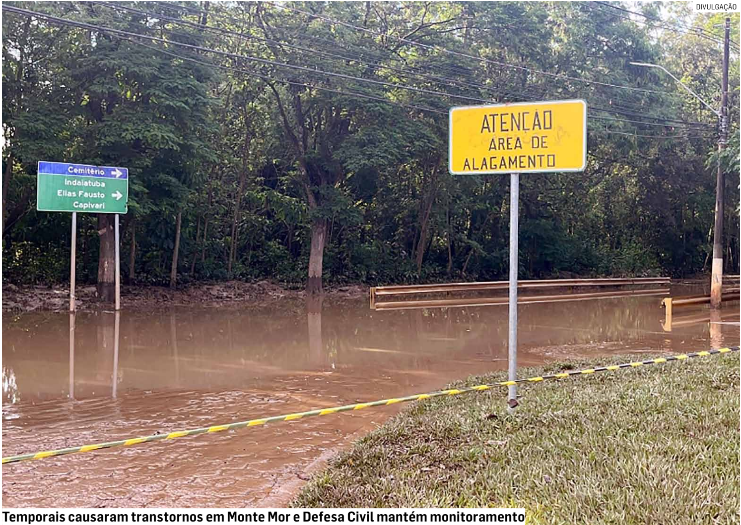
Temporais causaram transtornos em Monte Mor e Defesa Civil mantém monitoramento

O volume de chuvas registrado na primeira quinzena de dezembro de 2025 supera e muito o mesmo período de 2024 e coloca as Defesas Cíveis da região em estado de alerta. Somados os acumulados dos seis municípios — Hortolândia, Monte Mor, Nova Odessa, Paulínia, Sumaré e Americana — a região já contabiliza 1.097,76 milímetros de chuva nos primeiros 15 dias, volume 80,6% maior que o registrado ano passado, quando o total foi de 607,8 mm. O índice equivale a 1.097 litros de água por metro quadrado na região, revelando a intensidade dos temporais. Os dados são do Centro Integrado de Informações Agrometeorológicas (Ciiagro). Monte Mor lidera o ranking regional de precipitações, com 216,14 mm, e está em estado de atenção, segundo a Defesa Civil municipal. Neste domingo (14), o nível do Rio Capivari atingiu a cota de transbordo, provocando alagamentos pontuais em bairros localizados a jusante do rio, como Vila Farid Calil,