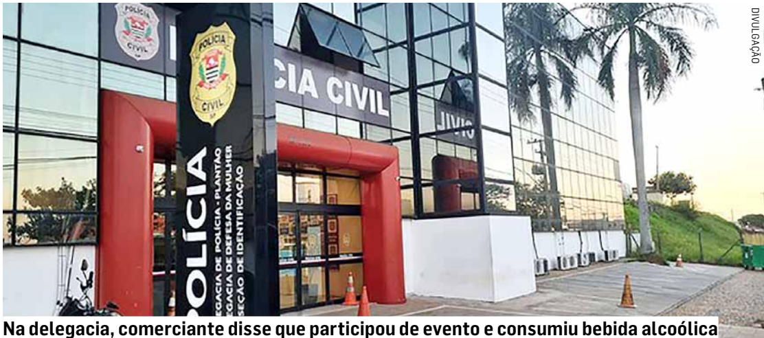
Na delegacia, comerciante disse que participou de evento e consumiu bebida alcoólica

Segundo informações registradas pela Polícia Civil, equipes da Polícia Militar realizavam patrulhamento de rotina pela região quando foram acionadas para atender uma ocorrência de um indiví-