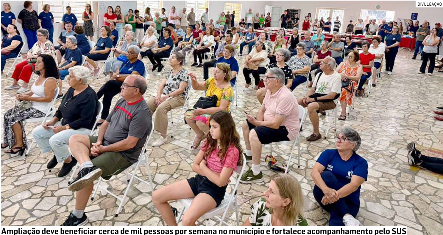
Ampliação deve beneficiar cerca de mil pessoas por semana no município e fortalece acompanhamento pelo SUS