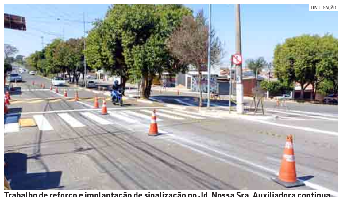
Trabalho de reforço e implantação de sinalização no Jd. Nossa Sra. Auxiliadora continua

trânsito, são desenvolvidas mais ações, que vão além do reforço e implantação da sinalização e a readequação do sentido do tráfego em ruas e avenidas. São atividades educativas com motoristas e pedestres até a implantação de semáforos e radares controladores de velocidade, principal medida adotada pela Administração Municipal. Os dispositivos começaram a funcionar em janeiro de 2019. Outra medida importante é a instalação dos painéis eletrônicos informativos nos portais de entrada e saída da cidade e investimentos na malha cicloviária, que, neste ano chegará a 50 quilômetros de um total de 100 quilômetros que serão implantados.