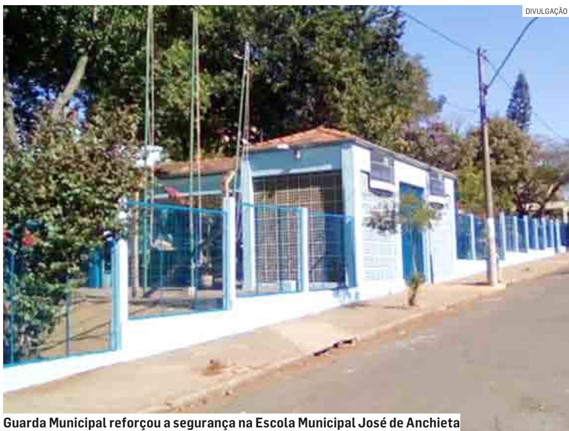
Guarda Municipal reforçou a segurança na Escola Municipal José de Anchieta

SUMARÉ | CENTRO | NOVA VENEZA | PICERNO | MARIA ANTONIA | ÁREA CURA | MATÃO | HORTOLÂNDIA | NOVA ODESSA | MONTE MOR | ELIAS FAUSTO | PAULÍNIA