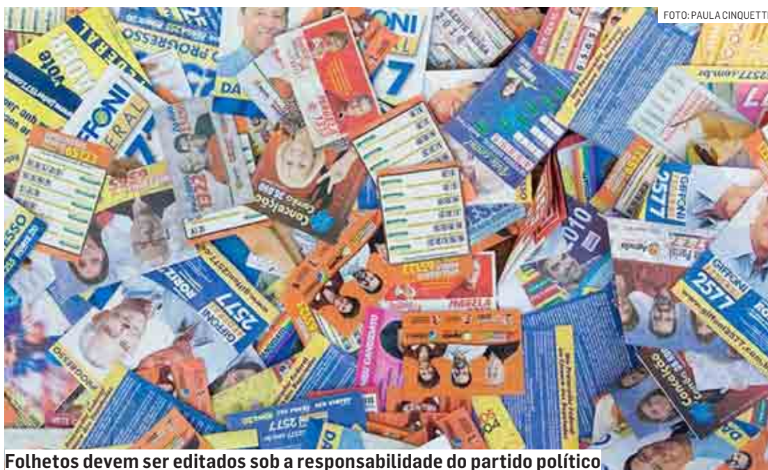
Folhetos devem ser editados sob a responsabilidade do partido político

Não poderá haver propaganda que divulgue ou compartilhe fatos sabidamente inverídicos ou gravemente desconhecidos, textualizados que atinjam a integridade do processo eleitoral; que ofe-