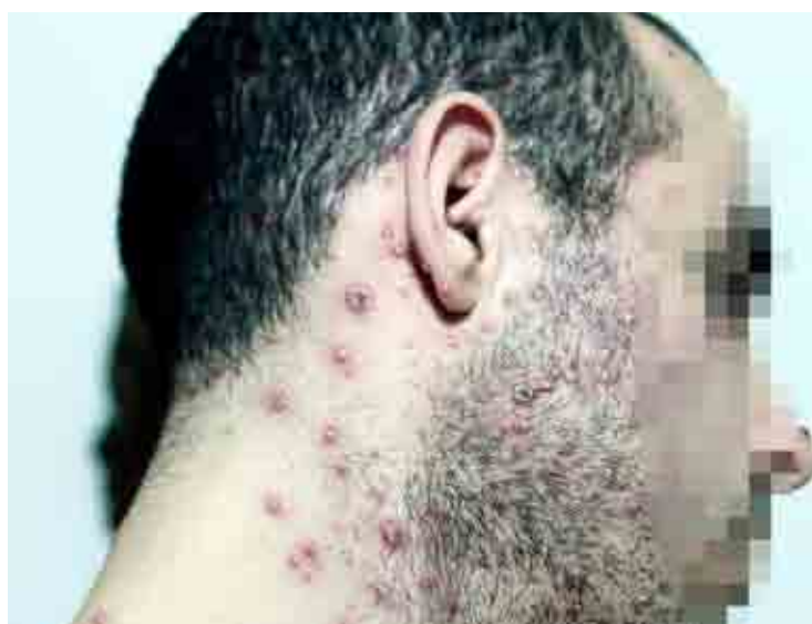
Em casos suspeitos e positivos da doença, deve-se fazer o isolamento e evitar compartilhamento de objetos