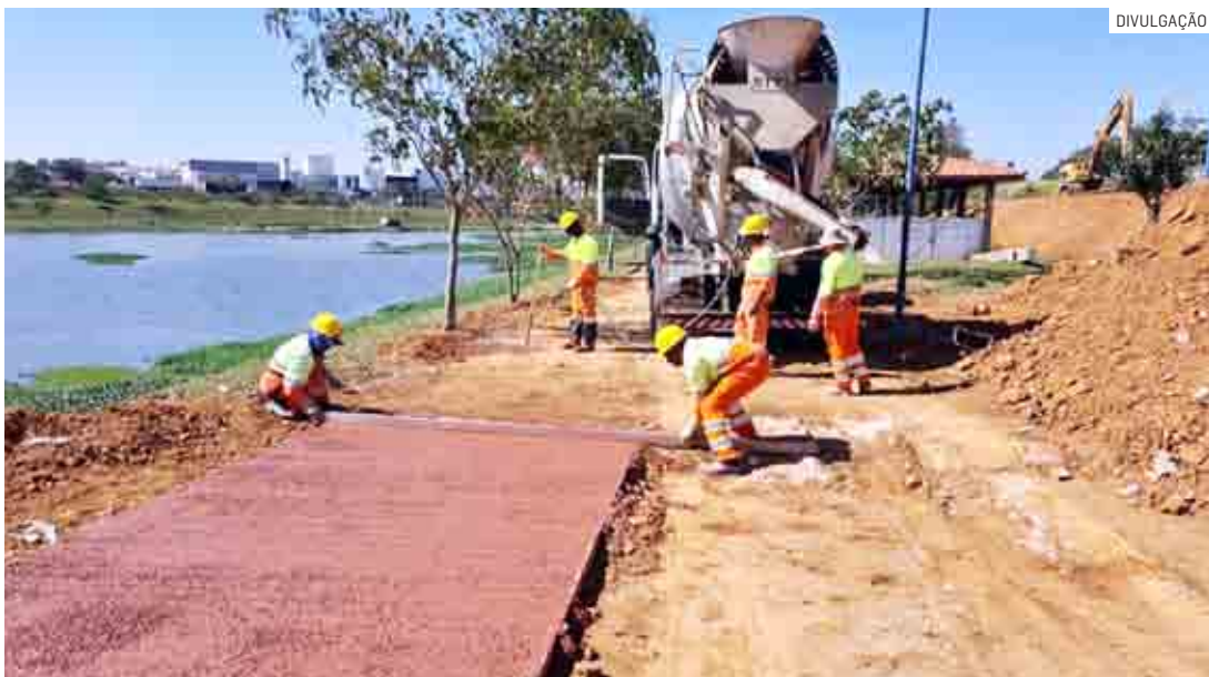
Trecho do Superviário, em obras de duplicação, fica ao lado do Parque Remanso das Águas

Da Redação | HORTOLÂNDIA tribunaliberal@tribunaliberal.com.br