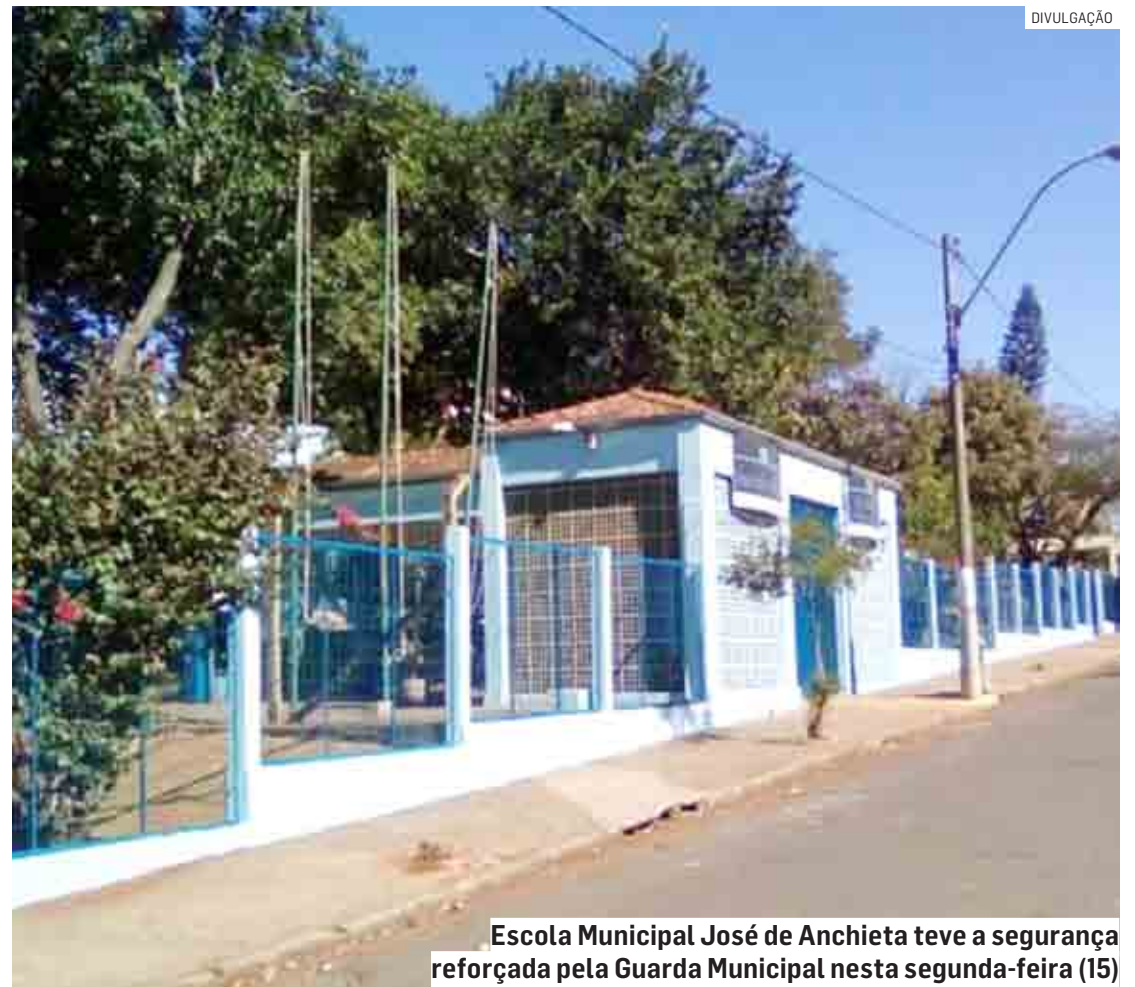
Escola Municipal José de Anchieta teve a segurança reforçada pela Guarda Municipal nesta segunda-feira (15)

As aulas na escola transcorreram normalmente nesta segunda-feira, sem nenhum incidente.