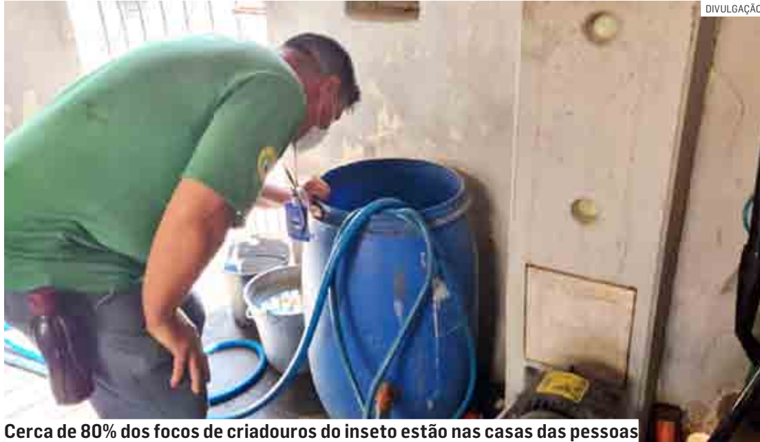
Cerca de 80% dos focos de criadouros do inseto estão nas casas das pessoas

A UVZ reforça a orientação para que os moradores permitam a entrada dos agentes em suas