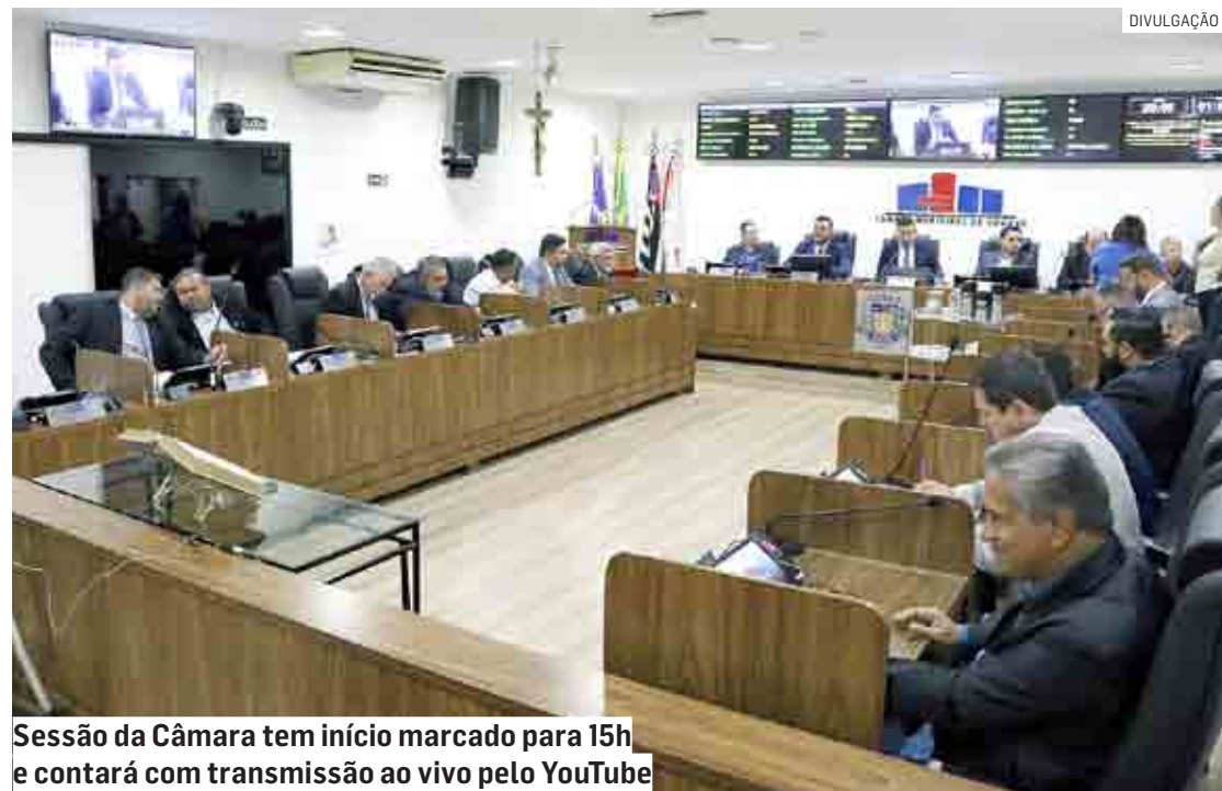
Sessão da Câmara tem início marcado para 15h e contará com transmissão ao vivo pelo YouTube

Da Redação | SUMARÉ tribunaliberal@tribunaliberal.com.br