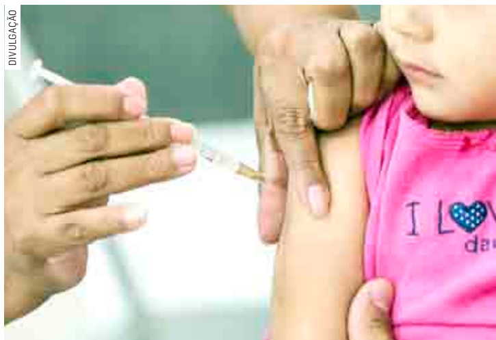
Campanha de multivacinação é para atualizar a carteira de vacinação de crianças e adolescentes de 0 a menos de 15 anos

A Administração reforça a orientação que é obrigatório o uso de máscara, inclusive de pessoas acompanhantes, dentro das unidades de saúde durante as vacinações. É necessário levar a carteira de vacinação, CPF (Cadastro de Pessoa Física) e/ou CNS (Cartão Nacional de Saúde) da criança ou do adolescente. No caso