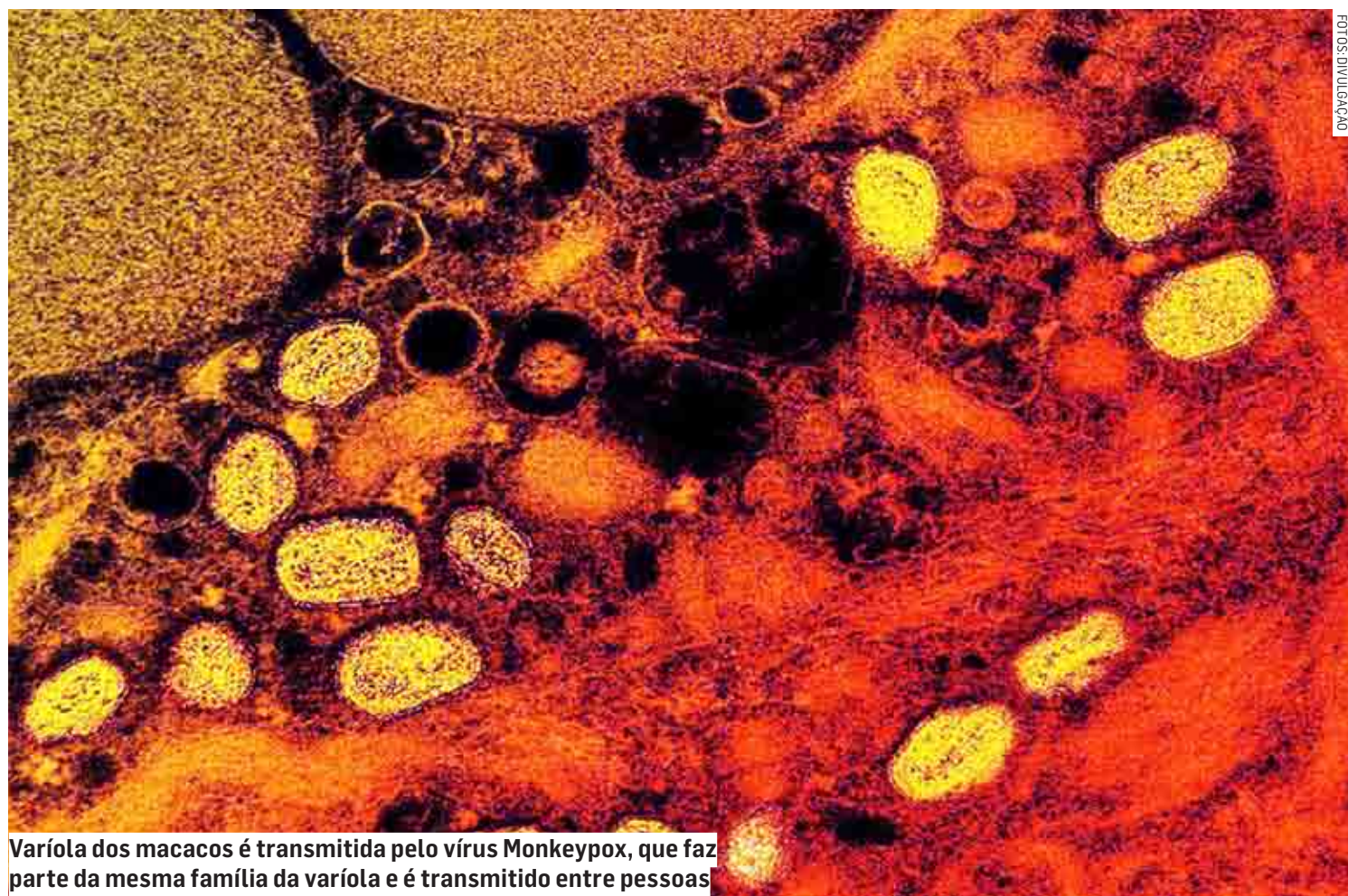
Varíola dos macacos é transmitida pelo vírus Monkeypox, que faz parte da mesma família da varíola e é transmitido entre pessoas

“Desde segunda-feira (15), todas as unidades de saúde estão preparadas para atender à população, de forma a realizar o diagnóstico adequadamente. As pessoas que procurarem uma uni-