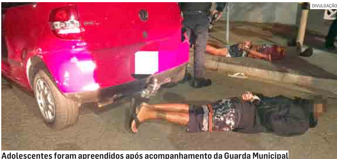
Adolescentes foram apreendidos após acompanhamento da Guarda Municipal

Cézar Oliveira | HORTOLÂNDIA tribunaliberal@tribunaliberal.com.br