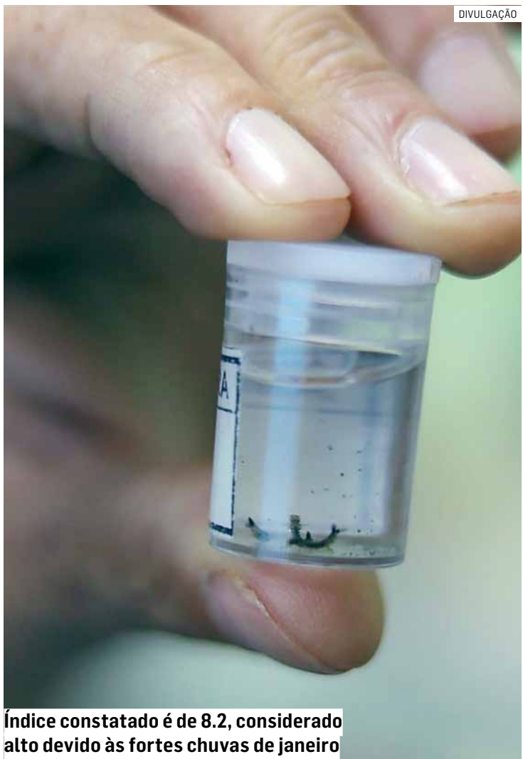
Índice constatado é de 8,2, considerado alto devido às fortes chuvas de janeiro

Durante a ADL, os agentes recolhem, identificam e contabilizam algumas das larvas para gerar o chamado Índice de Breteau, que mede a quantidade de larvas encontradas. O índice é dividido em três escalas: de 0 a 1, considerado baixo; de 1 a 4, médio; e acima de 4, alto. O índice obtido em janeiro do ano passado foi 6,2.