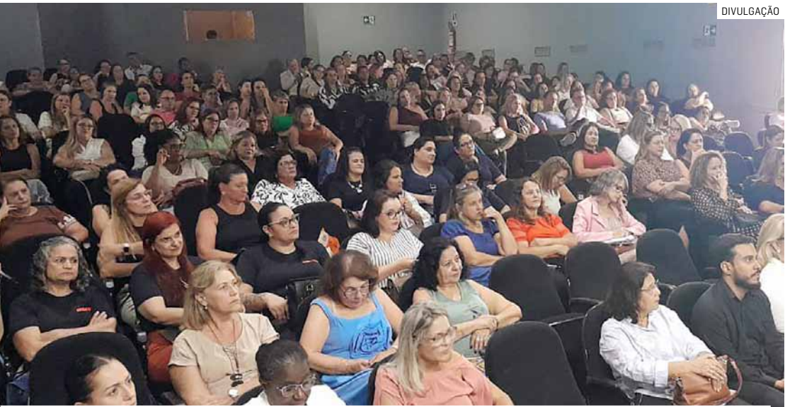
Reunião estratégica teve como foco alinhamento de objetivos e dados sobre alfabetização

Da Redação • SUMARÉ tribunaliberal@tribunaliberal.com.br