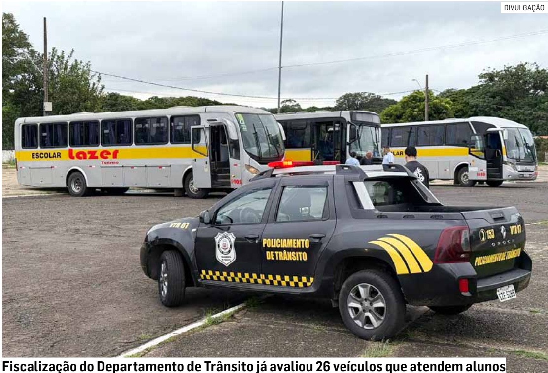
Fiscalização do Departamento de Trânsito já avaliou 26 veículos que atendem alunos

Durante a fiscalização, são verificados diversos itens de segurança, incluindo documentação dos veículos e dos motoristas, sinalização e toda a estrutura do transporte. “Até agora, 26 veículos já foram vistoriados, ficando apenas três pendentes. Alguns tiveram observações simples, como uma seta queimada ou um limpador de para-brisa que precisa de ajuste, coisas simples de resolver. Esses veículos vão ser reapresentados na Diretoria de