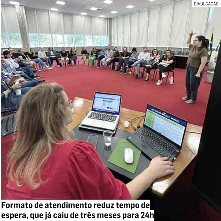
Formato de atendimento reduz tempo de espera, que já caiu de três meses para 24h

“A iniciativa mudou a dinâmica de atendimento dos pacientes, dividindo-os em equipes com cores para cada área da região atendida pela UBS. Com isso, os profissionais da saúde de cada cor conseguem desenvolver um atendimento profundo e personalizado para cada paciente, analisando-o como um todo, considerando condições socioeconômicas e sociais que possam influenciar seu