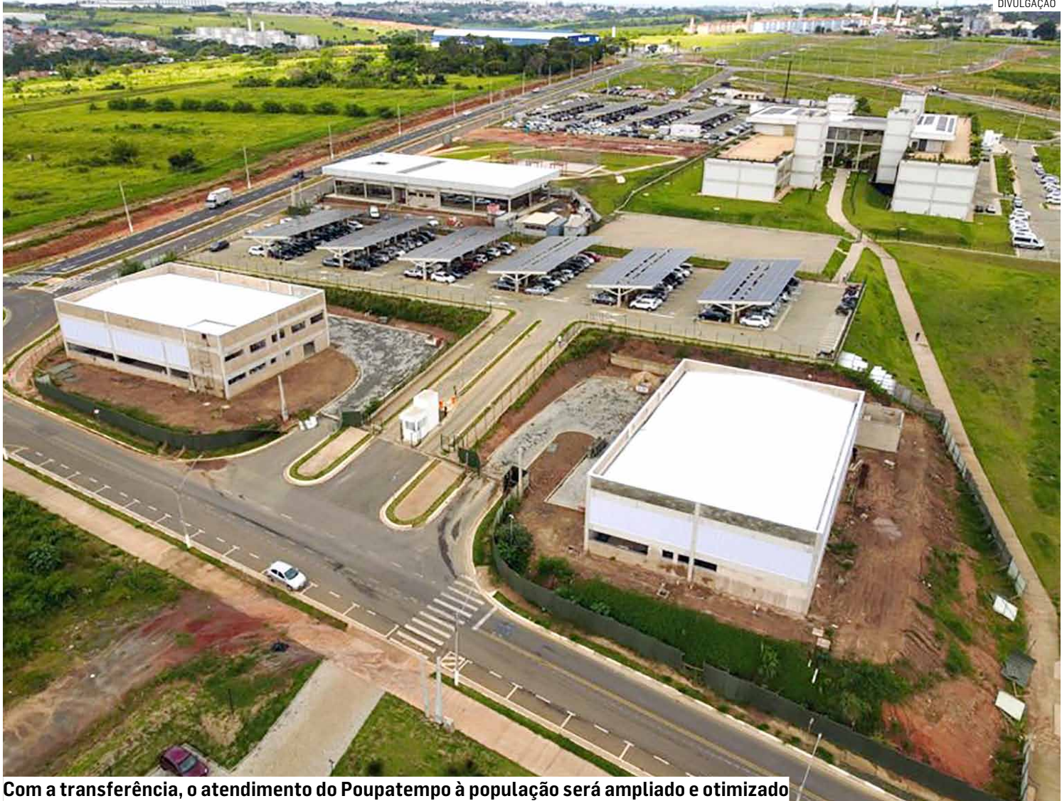
Com a transferência, o atendimento do Poupatempo à população será ampliado e otimizado

Com a vinda do atendimento do Poupatempo para o complexo do Paço Municipal, a Prefeitura de Hortolândia facilitará a vida do munícipe, centralizando numa mesma área a resolução de várias necessidades da população. No prédio da prefeitura, o cidadão já encontra atendimentos para serviços relacionados ao IPTU (Imposto Predial Territorial Urbano), PAT (Posto de Atendimento ao Trabalhador), regulação da saúde, Junta Militar, Cartão Fácil Inclusivo, entre outros. Após a mudança do Poupatempo para a mesma região, a população terá ali serviços como emissão da CIN (Carteira