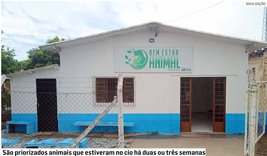
São priorizados animais que estiveram no cio há duas ou três semanas

A solicitação da castração pode ser feita de forma online ou presencialmente na sede do Bem-Estar Animal. Após a realização do cadastro, os tutores deverão aguardar o contato da equipe responsável, que fará o agendamento conforme a disponibilidade e os critérios estabelecidos. O Bem-Estar Animal está localizado na Rua Arthur Borcato, 105, no bairro Parque do Café. O município orienta que os interessados realizem o cadastro o quanto antes, considerando o número limitado de vagas disponíveis.