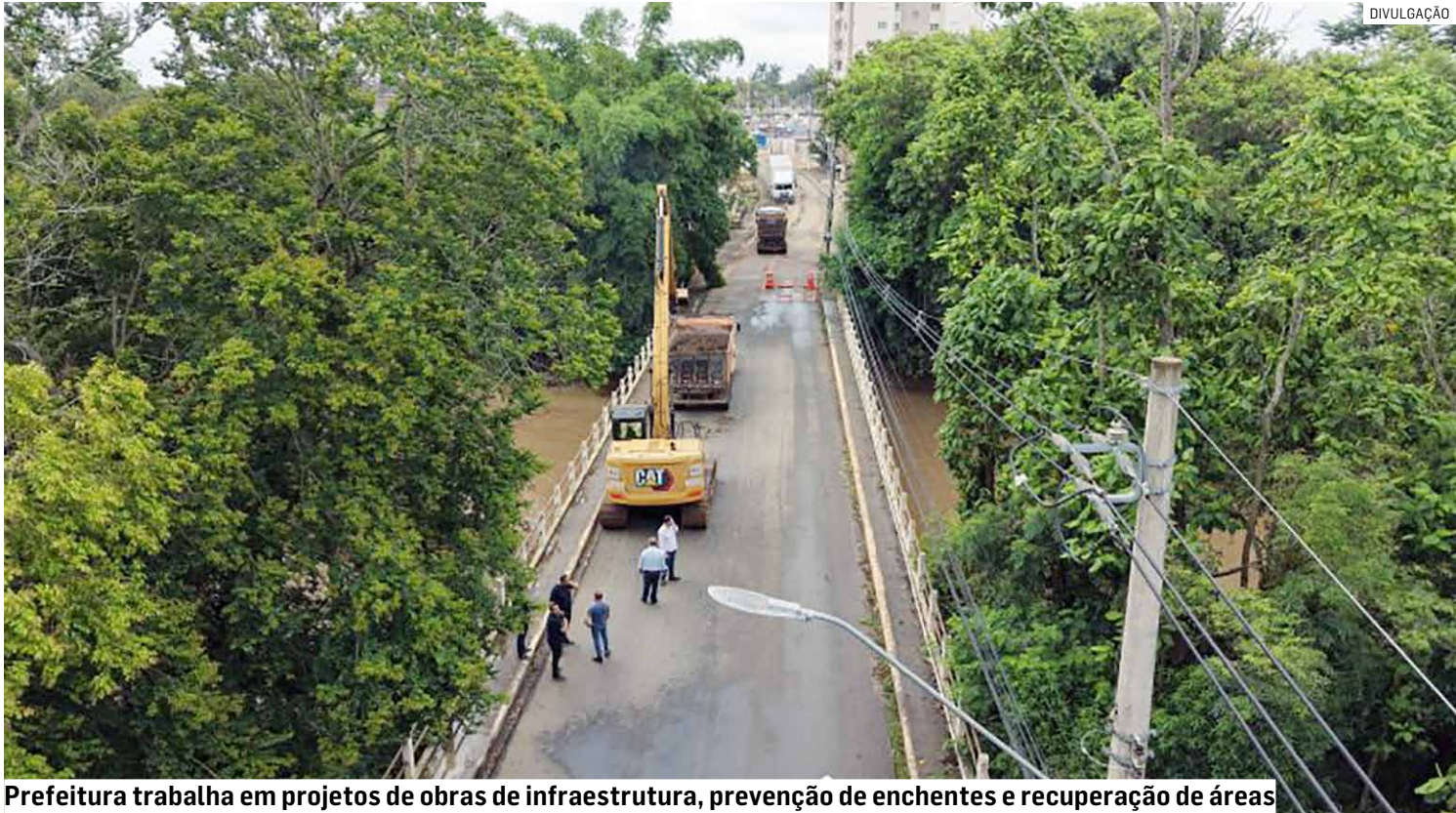
Prefeitura trabalha em projetos de obras de infraestrutura, prevenção de enchentes e recuperação de áreas