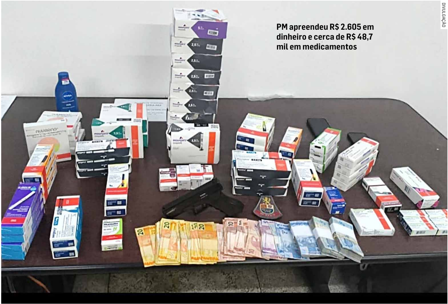
PM apreendeu R$ 2.605 em dinheiro e cerca de R$ 48,7 mil em medicamentos

Durante o cerco, o carro foi encontrado abandonado ao lado do Atacadão, com o miolo da ignição danificado. A cerca de 40 metros do veículo, os policiais localizaram duas mochilas contendo grande quantidade