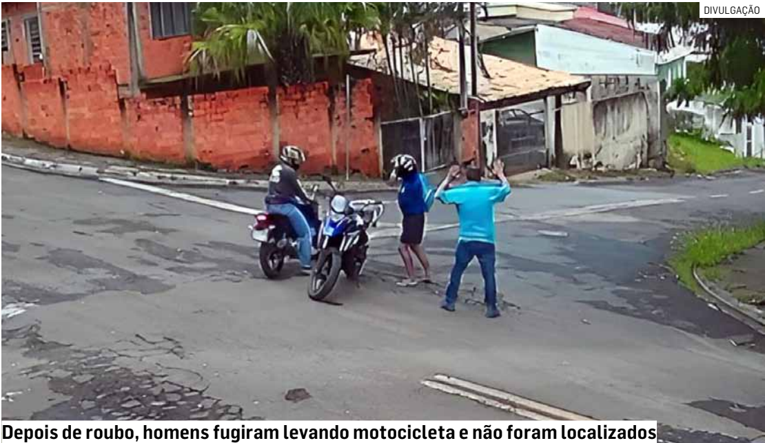
Depois de roubo, homens fugiram levando motocicleta e não foram localizados

A motocicleta foi recuperada e o caso segue sob investigação. Até o momento, nenhum suspeito foi preso.