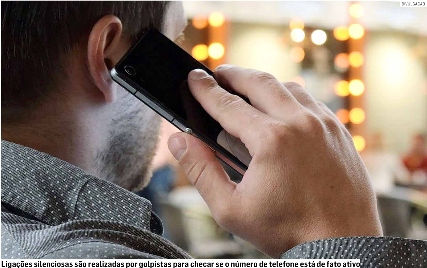
Ligações silenciosas são realizadas por golpistas para checar se o número de telefone está de fato ativo.

O problema, no entanto, vai muito além das chamadas mudas. O estudo, realizado ao longo de 2025, revela que 88% dos moradores do Estado (cerca de 30 milhões de pessoas) já foram alvo de algum tipo de tentativa de golpe digital. Mensagens suspeitas, e-