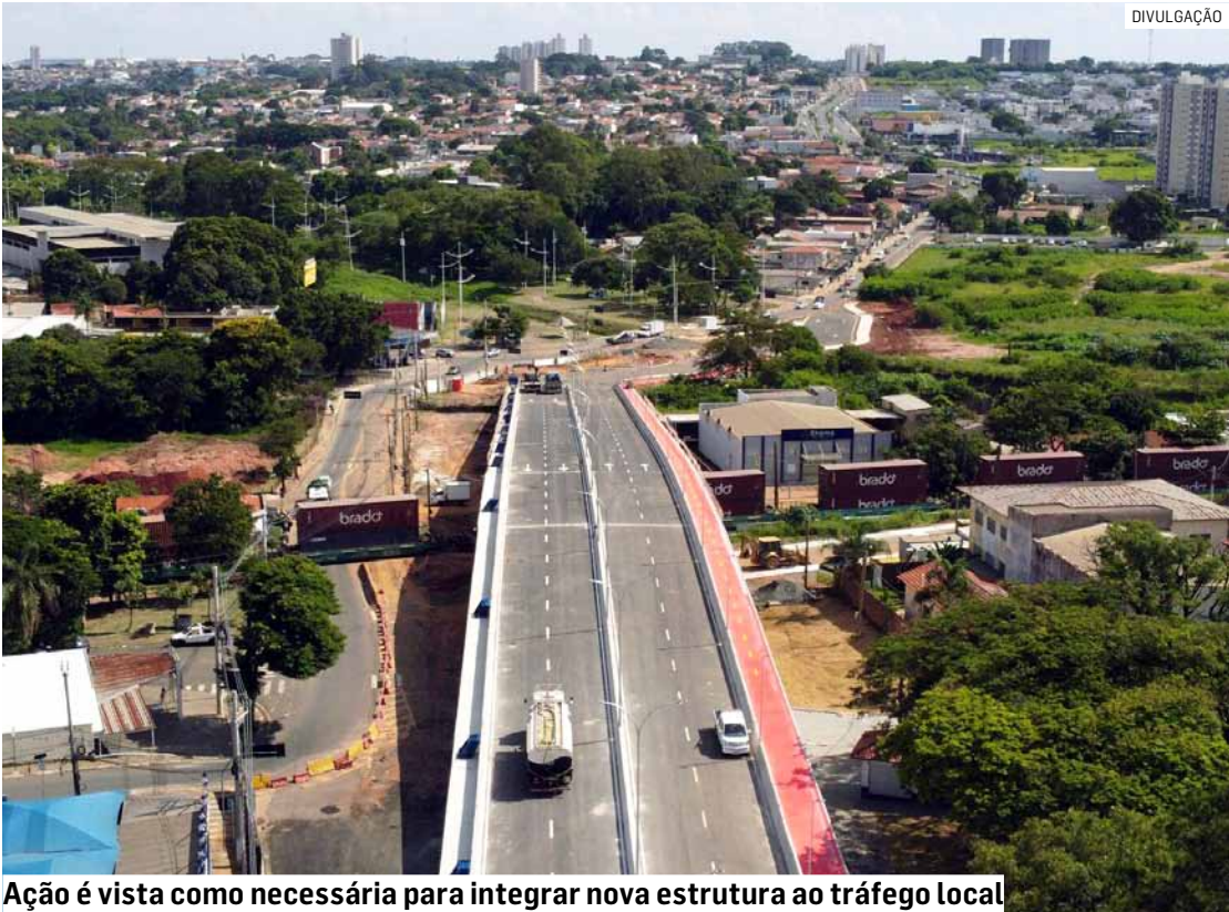
Ação é vista como necessária para integrar nova estrutura ao tráfego local

ro”, afirmou o secretário. No final de janeiro, equipes da prefeitura já realizaram serviços de fresagem, pavimentação e sinalização entre as avenidas Thereza Ana Cecon Breda e São Francisco de Assis, no trecho que dá acesso à outra extremidade do viaduto. Além destas intervenções realizadas pela prefeitura, a concessionária Rumo, que administra a ferrovia, prossegue com as últimas etapas da obra do viaduto. Ainda não há data para liberação do trânsito pelo dispositivo. O novo viaduto corrigirá décadas de improvisos urba-