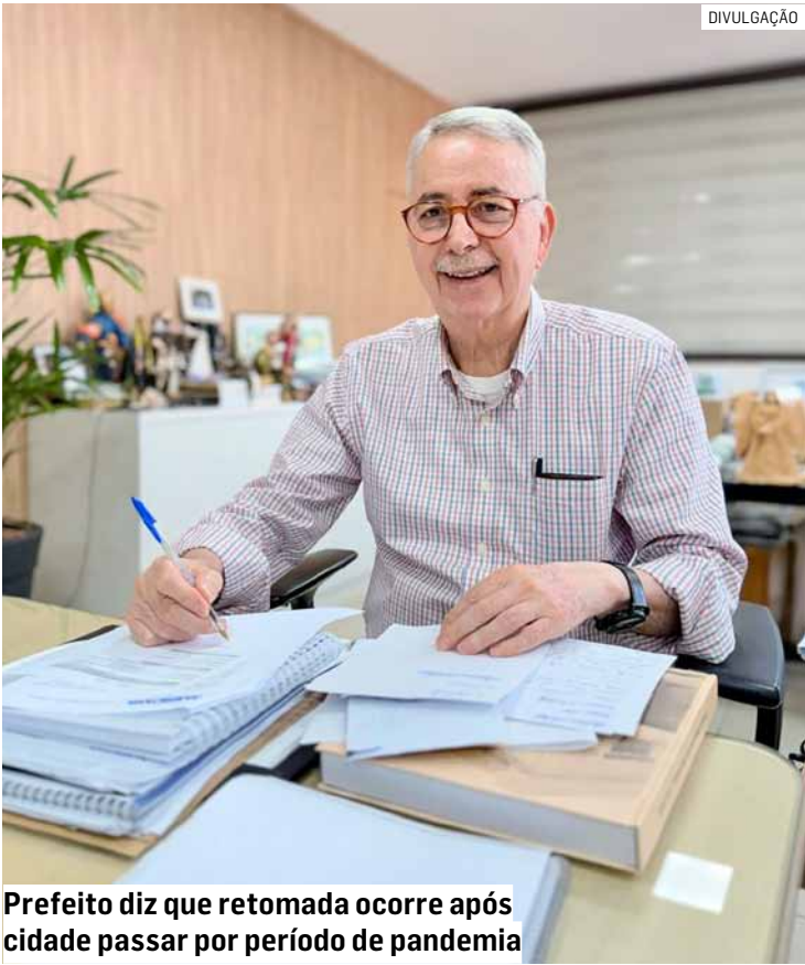
Prefeito diz que retomada ocorre após cidade passar por período de pandemia

Com relação ao pagamento de valores retroativos, a Prefeitura de Americana iniciou um estudo visando o levantamento total dos valores correspondentes. “O trabalho é minucioso e vai apurar o montante referente ao período do congelamento. Após essa etapa serão verificadas as questões orçamentárias e legais visando a devolução dos valores apurados”, disse o secretário.