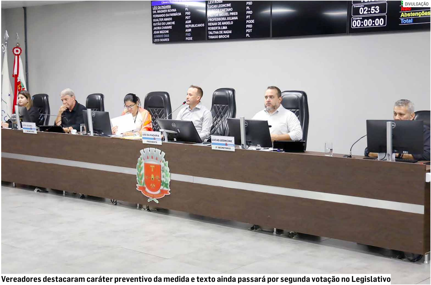
Vereadores destacaram caráter preventivo da medida e texto ainda passará por segunda votação no Legislativo